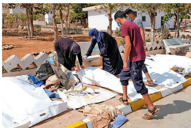
倖存者12日在德爾納市醫院外辨認遇難者遺體。