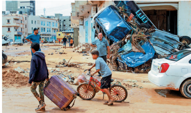
利比亞局勢長年動盪，基礎設施脆弱，無力抵禦天災。

【大公報訊】綜合《紐約時報》、美聯社報道：利比亞薩德克·智庫創始人戈馬蒂指出，颶風「丹尼爾」造成的災難不僅是天災，也是利比亞治理體系長期崩潰的人禍。2011年3月，美國及其盟友打着「民主」的旗號對利比亞發動政變，幫助利比亞反對派推翻卡扎菲政權，利比亞隨後陷入長期內亂，水壩等關鍵基礎設施得不到維護。