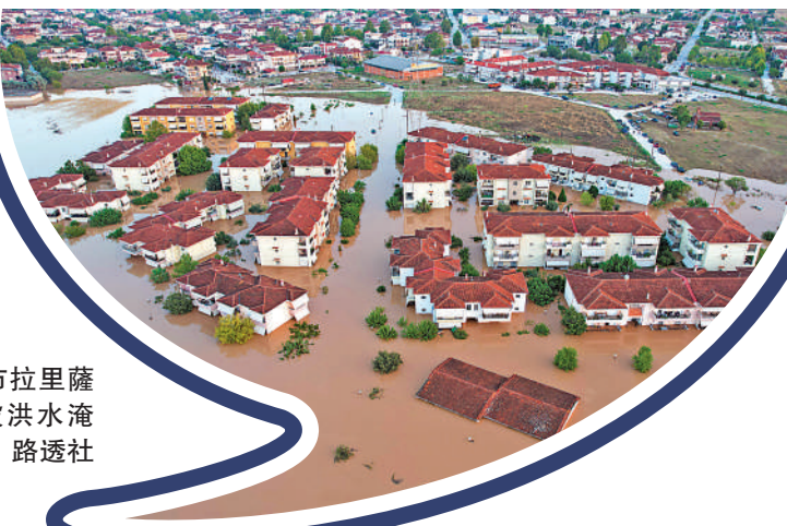
希臘中部城市拉里薩周邊地區9日被洪水淹沒。

地中海颶風（Medicane）是一種特殊的風暴，既非純種的熱帶氣旋，也非溫帶氣旋，而是地中海高空冷渦誘發的一種半熱帶氣旋，極易導致特大暴雨。地中海颶風通常在深秋或冬季出現，此時地中海海溫已下降，暴雨持續時間不長。但今年地中海出現了30℃高溫，地中海颶風「丹尼爾」威力加強。