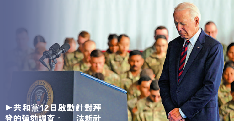
共和黨12日啟動針對拜登的彈劾調查。

彈劾調查是彈劾美國總統前的程序，可以讓國會獲得更大權力以獲取相關文件或傳召證人作證。完成調查後，眾議院需起草彈劾條款，首先獲得過半眾議員支持，再提交參議院得到三分之二以上參議員支持。由於共和黨在眾議院僅有微弱優勢，參議院則是民主黨佔優，針對拜登的彈劾料不會走到最後一步。