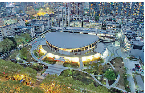
▲杭州體育館整體造型酷似「船體」。

距離杭州亞運會開幕的時間越來越近了。作為主辦城市杭州，記者提前探營杭州市拱墅區的亞運場館，感受這裏建築、歷史、文化和科技的融合。