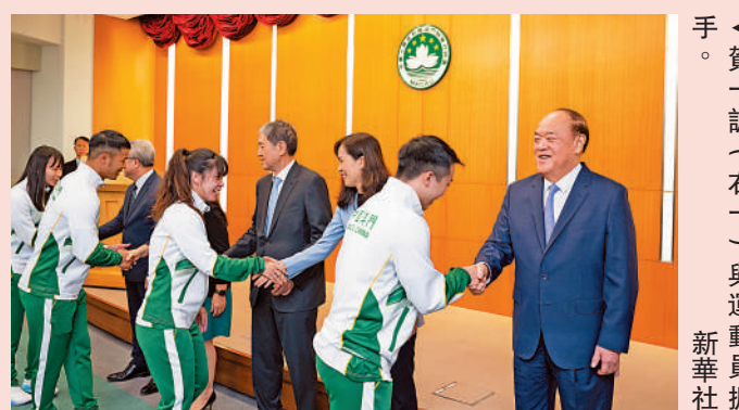
賀一誠（右一）與運動員握手。

自1982年亞運以來，中國已經連續10屆實現金牌榜、獎牌榜首位。自1978年亞運以來，浙江共誕生了105位亞運冠軍，奪得148枚亞運金牌。2010年廣州亞運，浙江共奪得26金，為歷史最佳戰績；2018年雅加達亞運，浙江斬獲24金，是境外參賽最好成績。