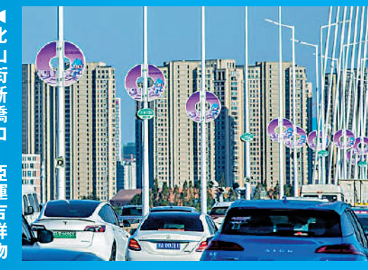
▲西興大橋上，亞運燈箱十分醒目。