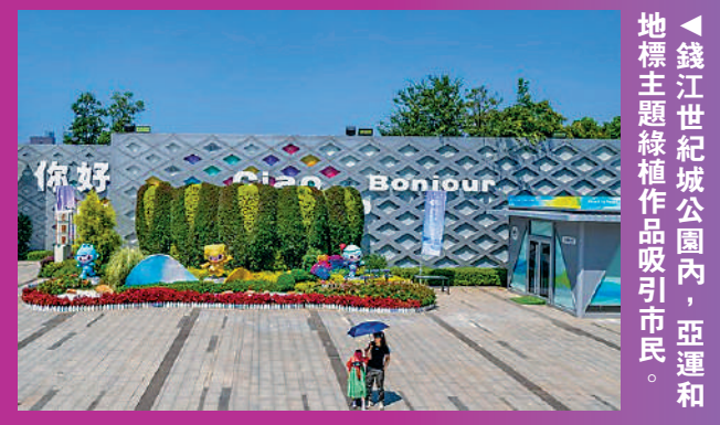
▲錢江世紀城公園內，亞運和地標主題綠植作品吸引市民。