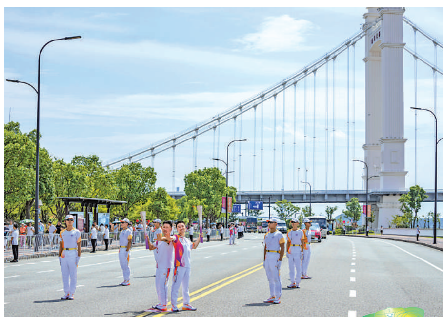
火炬昨在舟山傳遞。

據悉，舟山站火炬傳遞路線以「潮湧大東海，舟山向未來」為主題，線路總長10.9公里，共有170棒火炬手參加傳遞，平均每棒火炬手運行約65米，整個火炬傳遞過程歷時約150分鐘。