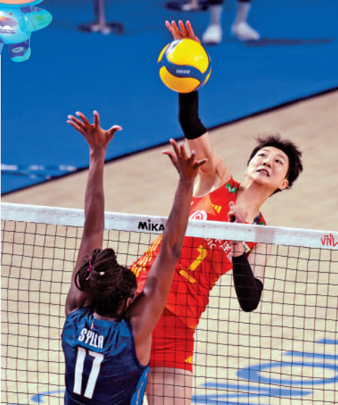
▲袁心玥（右）是中國女排隊長。