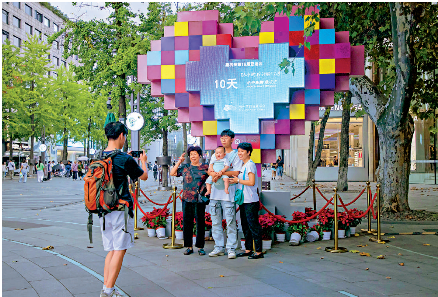
▲遊客在杭州西湖等地的亞運會倒計時裝置處，點開「AR服務」即可進入虛擬世界。圖為遊客在西湖邊的倒計時裝置拍照。