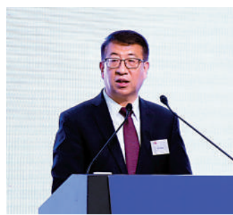
楚鋼表示，香港作為國際金融、貿易、航空中心，成為中國內地與國際社會的重要橋樑。