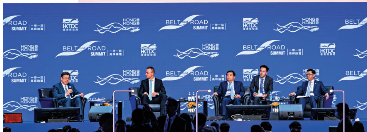
「一帶一路」推動區域合作與發展」政策對話環節，香港商務及經濟發展局局長丘應樺（左一），與匈牙利外交與對外經濟部部長西雅爾多（左二）、越南計劃與投資部部長阮志勇（左三）、馬來西亞外交部副部長莫哈末阿拉敏（左四）登台參與交流討論。