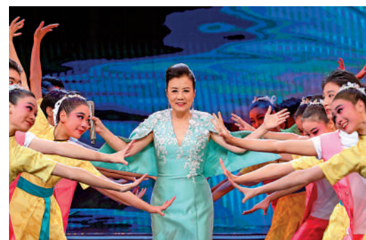
▲汪明荃獻唱名曲《萬水千山總是情》。

程多站」文旅推介、各地特色文化展示、文化交流合作論壇等百餘場文藝活動。香港特區政府政務司副司長卓永興表示，大灣區文化藝術節充分展現了三地同心打造標誌性文化品牌，共建大灣區文化圈的目標。他透露，2024年香港將承辦第四屆大灣區文化藝術節，並計劃於同月舉辦首屆香港演藝博覽活動，屆時將聯動文化藝術節產生協同效應，邀請世界各地的專業藝術家來港，建立大型的演藝交流平臺，拓展文藝業務合作，製作更多具有國際影響力的優秀項目。