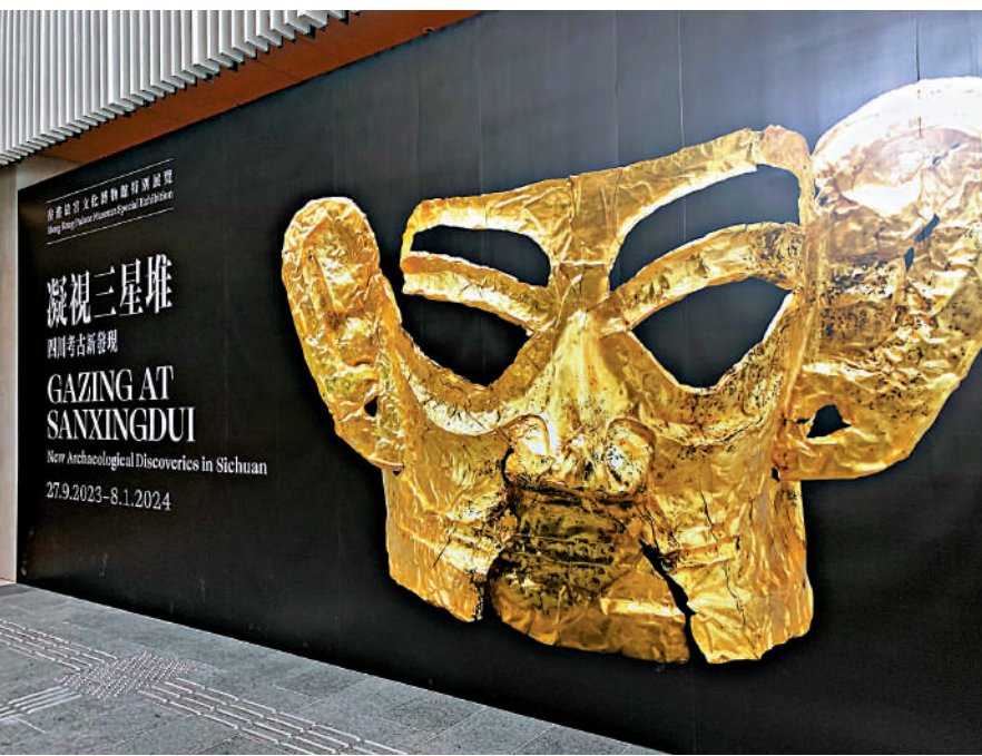
▲「凝視三星堆——四川考古新發現」即將開幕。大公報記者顏琨攝