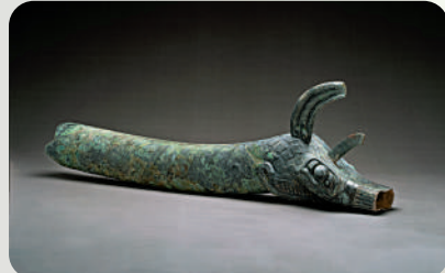
▲龍形器是2022年出土於三星堆遺址8號坑的文物。