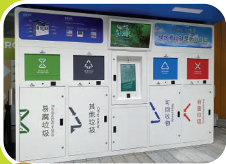
亞運村內隨處可見的垃圾分類箱。