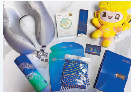
媒體包內部分為紀念品類、生活服務類及工作用品類。

媒體包的內部和外部都設置了很多收納空間，不僅可以放下電腦，還能分門別類放置數據線、穩定器、錄音筆等採訪器材，非常適合現在的全媒體記者們。打開媒體包，裏面的「寶貝」可真不少，主要分為亞運紀念品類、生活服務類、媒體工作用品類三大類。其中，吉祥物、水杯等亞運紀念品都採用了盲盒玩法，從2至4