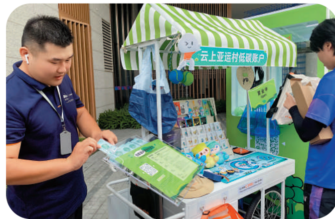
低碳積分可兌換各式各樣的低碳小禮品。