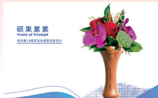
▲杭州亞運會頒獎花器設計。

【大公報訊】據新華社報道：「鮮花可能會慢慢凋零，但花器能夠成為永久的紀念。每個運動員將它帶回自己的家鄉，其實也是國家之間的一種文化交流。」