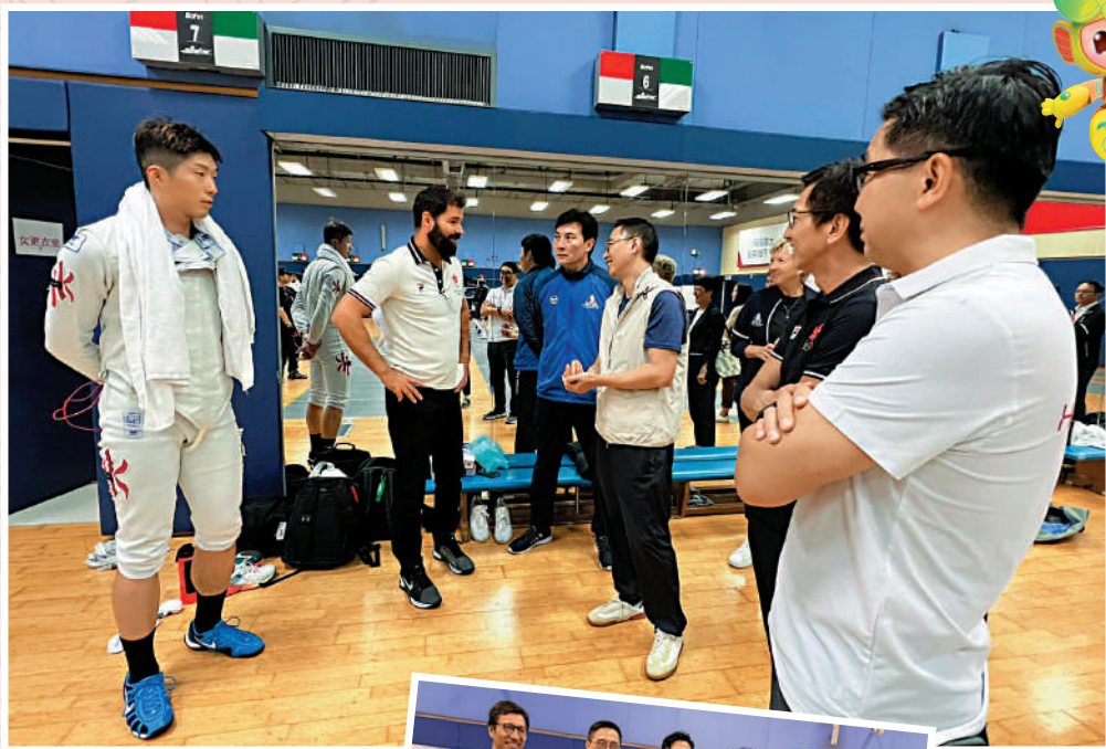
▲楊潤雄（左四）到訪體院探望劍擊隊，奧運冠軍張家朗（左一）亦在場。

亞運會和亞殘運會將分別於9月23至10月8日，以及10月22至28日舉行，中國香港將分別派出約660名運動員及約98名運動員參加亞運會和亞殘運會。除了體院會支援參與精英運動項目賽事的運動員外，文化體育及旅遊局亦從藝術及體育發展基金（體育部分）撥款7700萬元，支持其他參賽的運動員及其團隊，備戰亞運會及亞殘運會。