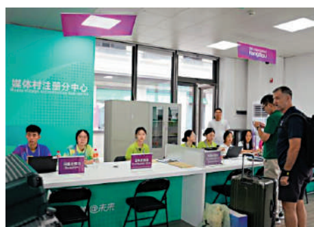
▲到亞運媒體村的記者在工作人員和志願者引導下辦理入住手續。

作區。媒體村餐廳的豐富美食，一日四餐的長時間服務，讓記者可以根據自己工作安排，在需要時間前來用餐，用更飽滿的精神和熱情，宣傳杭州亞運。