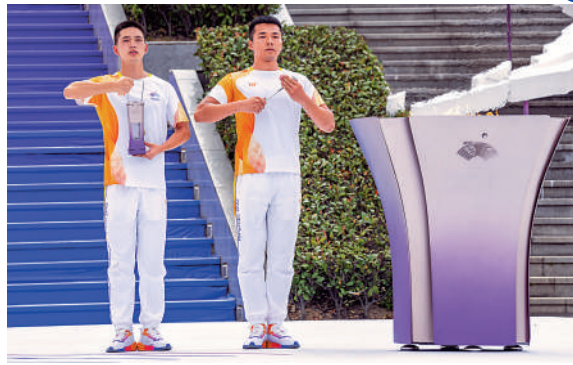
▲杭州亞運會火炬在浙江台州傳遞，圖為收火儀式現場。

火炬傳遞經過的中央商務區，是台州金融集結地，享譽全國的台州小微金融服務從這裏出發。火炬傳遞時，許多市民自發來到沿線道路旁，為奔跑中的火炬手搖旗吶喊、加油助威，歡呼聲此起彼伏。一路上，台州亂彈、黃沙獅子、三門牡丹龍等極具台州特色的節目輪番上演，一次次將傳遞活動的氛圍推向高潮，向全世界展示台州獨特的城市魅力和市民昂揚向上的精神風貌。