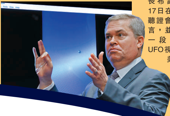
▼美國海軍情報局副局長布雷5月17日在UFO聽證會上發言，並播放一段疑似UFO視頻。