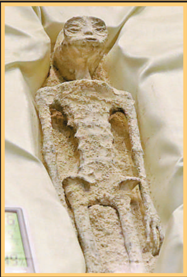
▲聽證會上公布的「外星人遺骸」之一。

當地時間12日，墨西哥首次「不明異常現象」（UAP）公開聽證會在首都墨西哥城召開，墨國記者兼「不明飛行物學家」海梅·毛桑與幾名研究人員一同展示兩具據稱是約一千年前的「非人類遺體」。