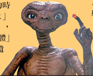
◀電影《E.T.外星人》主角。

【大公报訊】綜合路透社、《今日美國》、《紐約時報》報道：墨西哥國會12日首次召開「不明異常現象」（UAP）公開聽證會，公布了兩具小型的「外星人遺骸」，再次引發了人們對外星人的遐想。墨國立自治大學對「遺體」分析結論提出質疑；而各地網友則指，展出的「外星人遺骸」缺乏想像力，與荷里活電影的外星人相似。