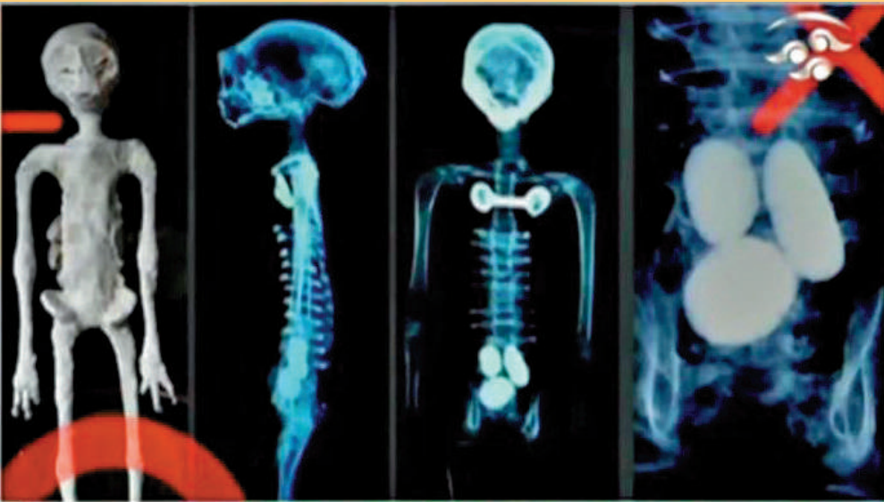
▲墨西哥聽證會展出兩具遺骸的X光照結果。