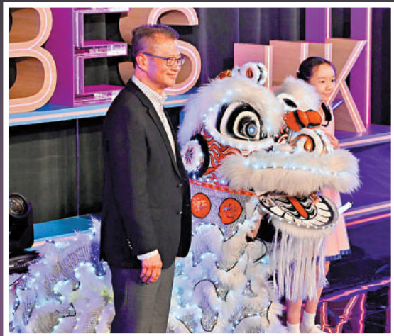
▲陳茂波昨日主持啟動禮，為「香港夜繽紛」揭開序幕。