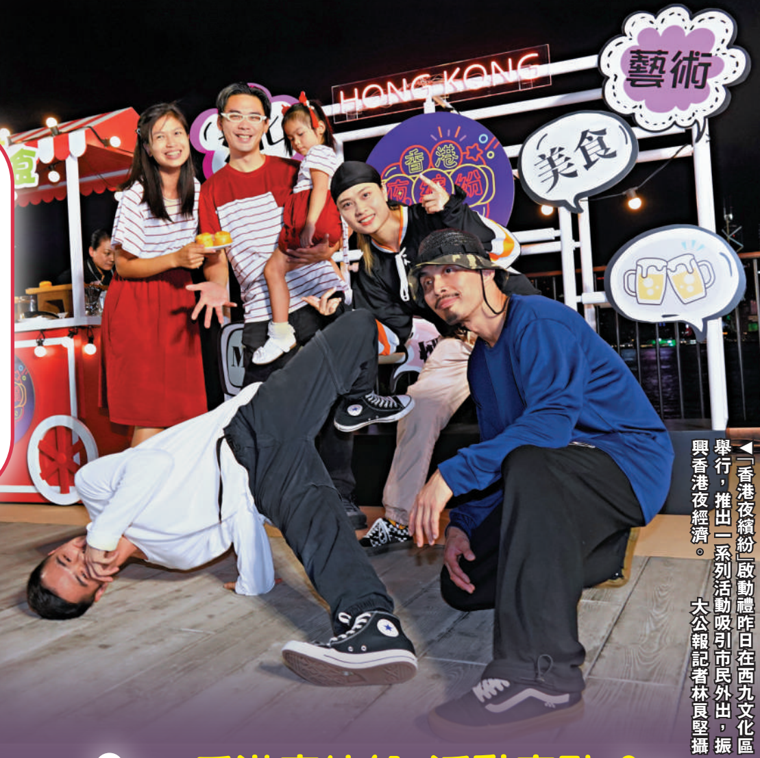
▲「香港夜繽紛」啟動禮昨日在西九文化區舉行，推出一系列活動吸引市民外出，振興香港夜經濟。