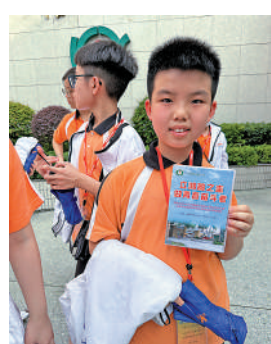
▲客村小學的同學為大家準備的小禮物。