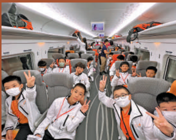
▲我們一起乘坐高鐵往廣州，參加兩日一夜的交流活動。