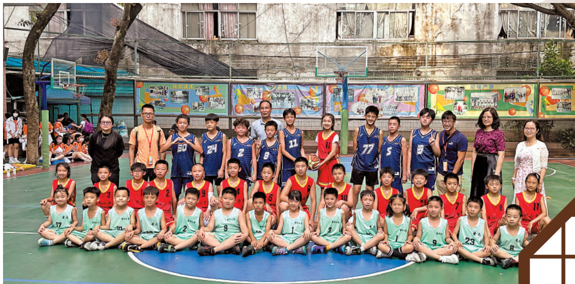
◀我們到訪姊妹學校廣州市海珠區客村小學，跟當地同學來一場籃球友誼賽。