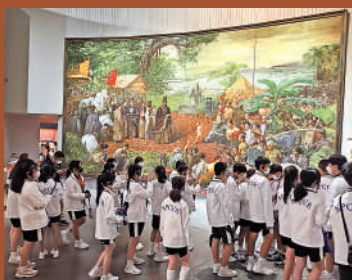
▲廣東省博物館中的歷史館，走一遍，可增長不少知識。