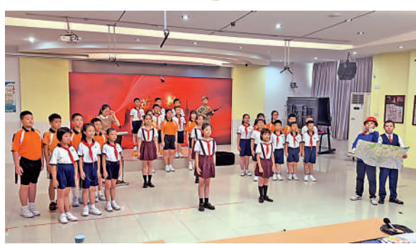
▲會合當地同學後，我們一起朗誦《英雄》，這是一首熱血的配樂詩。