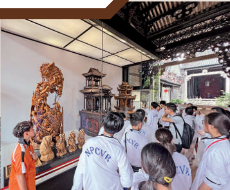
▲在陳家祠裏，有不少精緻的雕塑作品。