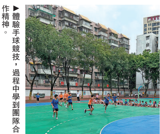
▶體驗手球競技，過程中學到團隊合作精神。