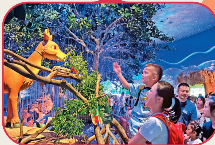
▲ 孩子們在長隆宇宙飛船園區與仿生動物互動。