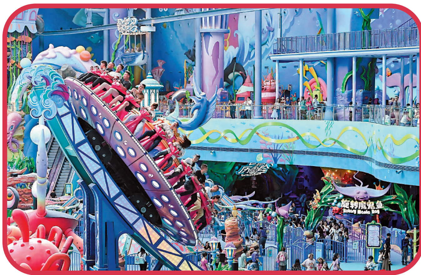
「全球最大的室內樂園」珠海橫琴長隆宇宙飛船於9月16日開放試營業，觀眾在園內暢玩各種遊樂設施。

橫琴創新方還透露，包括「港車北上」等自駕3小時免費停車，有場內消費、樂園門票或住宿憑證可再獲相應停車費減免。目前還開通香港跨境巴士直達園區，而且與廣珠城軌無縫連接免費穿梭巴士直達，可與多條精品路線串聯遊。