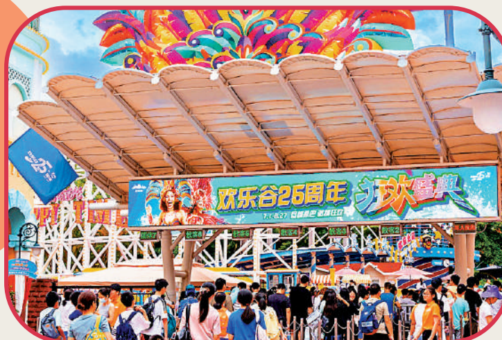
▲ 深圳歡樂谷25周年狂歡盛典激情啟幕，為遊客獻上旅遊狂歡盛宴。