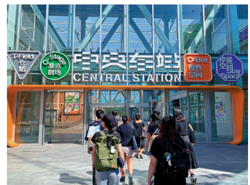
▲香港學生參觀朗園Station。