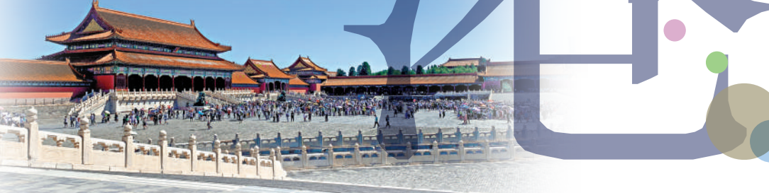
▼暑假期間，故宮博物院遊客絡繹不絕。

「教育燃新」設計學習內容。因疫情，首屆交流在去年11月啟動，於今年2月圓滿結束，95位來自北京和香港的大學生參與8場線上交流活動。