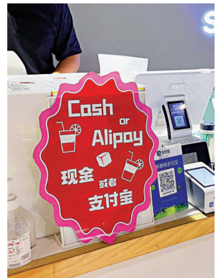
▲商家特別提醒國際遊客可使用移動支付。