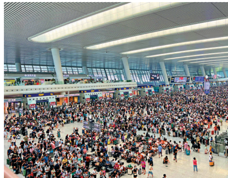
◀杭州亞運會已成為「引流密碼」，帶旺杭州甚至浙江全省的旅遊產業。