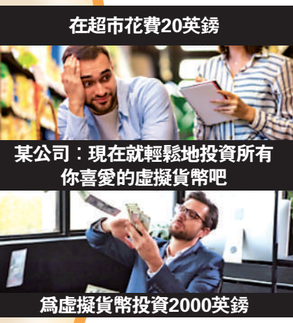
▲很多「金融網紅」涉非法推廣虛擬貨幣，引起監管機構關注。資料圖片

法國 本月7日，法國監管機構為「金融網紅」開設培訓課程，通過考試者可獲得「負責任影響力證書」。