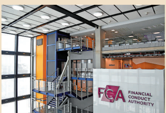
▲英國金融行為監管局(FCA)將出新規，加強監管「金融網紅」。資料圖片

【大公報訊】據Cointelegraph網站報道：本月7日，法國金融管理局(AMF)和公共專業監管局(ARPP)宣布為「金融網紅」開設培訓課程，涵蓋金融產品及相關服務。通過考試者可獲得「負責任影響力證書」。 法國當局最早於2021年推出「負責任影響力證書」，旨在規範各行業網紅的活動。AMF稱，鑒於金融投資成為眾多網紅關注的領域之一，當局特地開設相關課程，內容涵蓋股票、債券、基金、虛擬資產等金融產品，以及投資建議、投資組合管理等金融服務。「金融網紅」完成學習之後可參加考試，回答25道多選題，若正確率達到75%即可獲得證書。Cointelegraph網站指出，「負責任影響力證書」並非具有強制力的法律文件。 法國於今年5月通過一項修正案，允許已註冊的虛擬貨幣公司僱用「金融網紅」進行宣傳推廣。但據路透社報道，部分法國議員提出一項草案，要求禁止網紅推廣投資產品及虛擬資產。