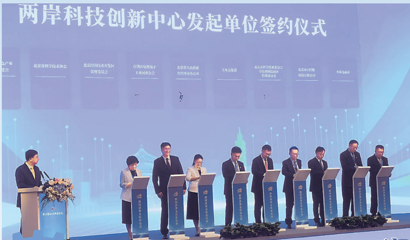
兩岸科技創新中心發起單位簽約儀式