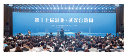
▲第十七屆「湖北·武漢台灣周」19日在武漢閉幕。

台商提供了發展機遇。本次活動簽約的項目，投資額超10億元的有9個，主要集中在鄂台合作比較成熟的半導體電子信息、精密製造、現代農業、生物醫藥、文創教育等領域。其中，台灣欣興集團擬在黃石市投資的電路板PCB鍍錫鑲鑽製造項目、敏實集團擬在咸寧市投資的汽車零部件製造項目、統一集團擬在武漢投資的華中超級智慧工廠項目，投資金額均達20億元。