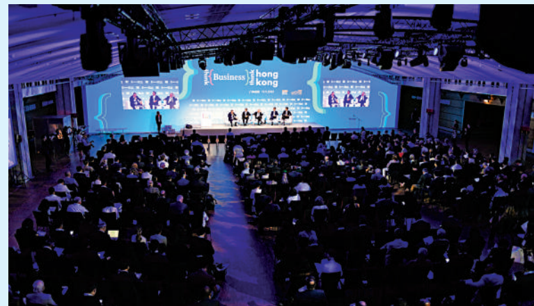
▲貿發局在論壇上表示，法國政府推出「法國2030」投資計劃，有不少領域是香港優勢所在。