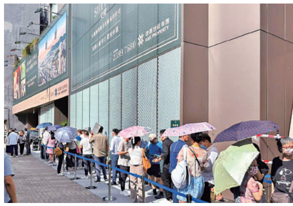
▲文曜售價曝光後，現場大排人龍。