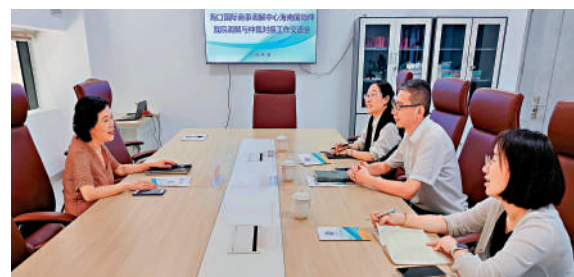
▲海南國際仲裁院副院長到海口國際商事調解中心進行調研。