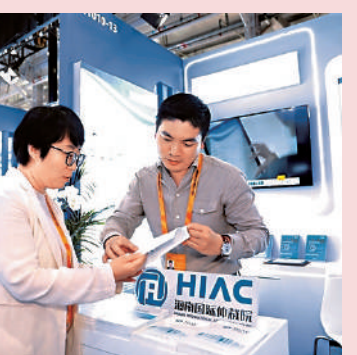
國際仲裁院工作人員與同行深入交流。

善信息管理方式，注意信息搜集、信息分類、信息分析和信息應用。加強與其他利益相關方溝通，充分利用國外中介機構，對投資貿易方的國別環境、行業和項目進行盡職調查，提高自身風險防範意識。