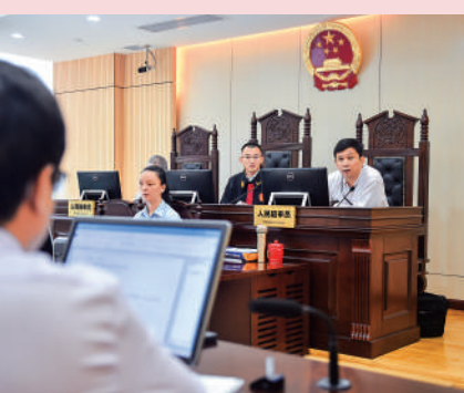
被申請人代理律師在審理過程中向新華社

解決現有規則和創新規則之間的關係，既要遵守現有的國際法準則，還要在這個基礎上改舊立新。」中國法學會國際經濟法學研究會會長沈四寶表示，特別是要講好我國全面依法治國、推進法治建設的故事