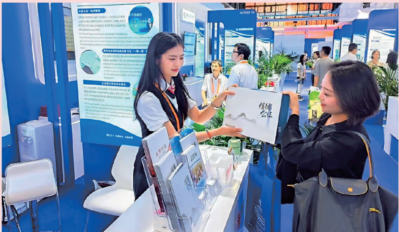
▲高質量共建「一帶一路」，離不開法治護航。圖為二〇二三年服貿會第三屆法律服務專題展覽會現場，公證人員解答參觀群眾法律問題諮詢。