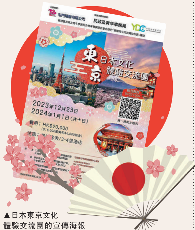
▲日本東京文化體驗交流團的宣傳海報顯示，該活動由屯門婦聯主辦，獲政府的「國際青年交流資助計劃」資助。

民政及青年事務局回覆《大公報》表示，若舉辦的交流活動能促進本地青年對「一帶一路」的認識，以及包含參訪當地中國駐外官方機構、內地大型知名企業或學術和研究機構等，會獲優先考慮。惟局方指資助計劃並沒有就個別國家設限，主辦機構可按自身的能力和作計劃自主選擇交流地點。民青局及委員會根據其評審準則擇優取錄，於2023年5月批出項目。局方表示，2023/24年度計劃下前往