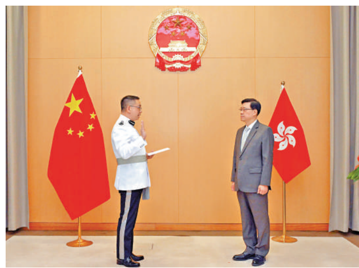
▲新任入境事務處處長郭俊峯昨日在行政長官李家超監督下宣誓就職。

區嘉宏在服務入境事務處34年後，即日開始退休前休假期。李家超讚揚區嘉宏出任入境事務處處長以來，一直努力確保出入境管制及旅客通關安排的流程暢順，並成功帶領入境事務處成為一支高效、專業的入境服務隊伍。