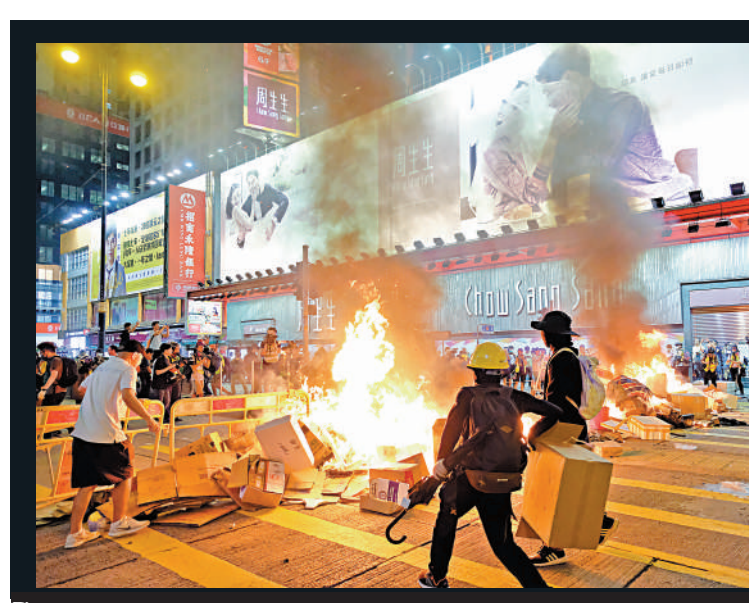
▲連登討論區在黑暴期間散佈煽動性的信息，包括討論示威者如何使用暴力手段對抗警方及如何破壞公共設施。