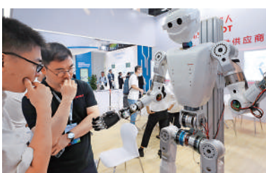
▲參觀者在上海一展會上圍觀機器人展品。

濟實現質的有效提升和量的合理增長。」陶青表示，一是加強政策協同落實。加緊實施十大重點行業穩增長工作方案，推動穩增長政策落地見效。二是加快促進需求恢復擴大。推進供給端創新，以高質量供給引領創造需求。引導企業因地制宜拓展國際市場，進一步挖掘出口潛力。三是深入實施智慧製造工程，加快改造提升傳統產業。系統推進5G、智慧網聯汽車、新材料等新興產業發展，培育一批增長新引擎，打造競爭新優勢。