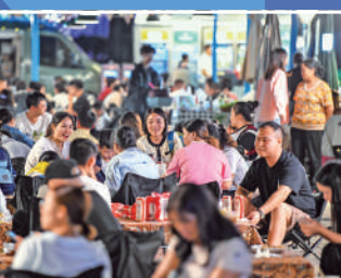
▲9月14日，遊客和市民在貴州興義馬嶺河夜間消費聚集區吃夜宵。

●7月底召開的國務院常務會議就今明兩年到期的階段性政策明確了後續安排，8月份以來各部門加快落實，對小微企業和個體工商戶稅費優惠、保交樓貸款支持計劃等政策予以了延期和優化。