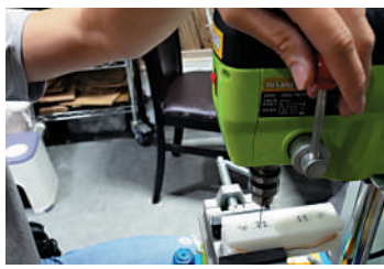
② 在板身鑽8個螺絲孔。