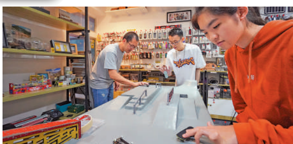
▲「怪怪柴工作室」內擺放了一座手指滑板場，令工作室逐漸成為指板玩家「切磋花式」的聚腳地。