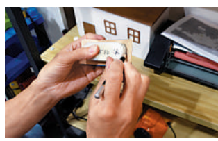
③ 畫好板型，之後用「砂帶」磨去多餘的部分。