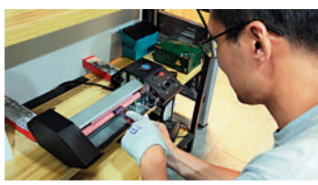
④ 加熱，將圖案印上板身(此步驟需反覆來回多次)。