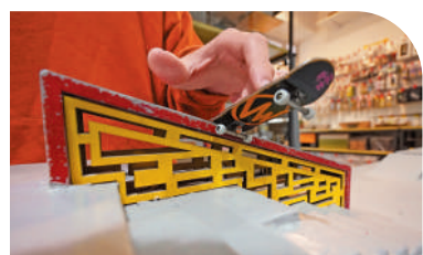
▲欄杆、樓梯是典型的手指滑板練習道具。