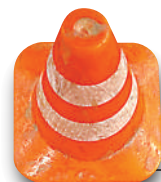
(以上是部分製作步驟)