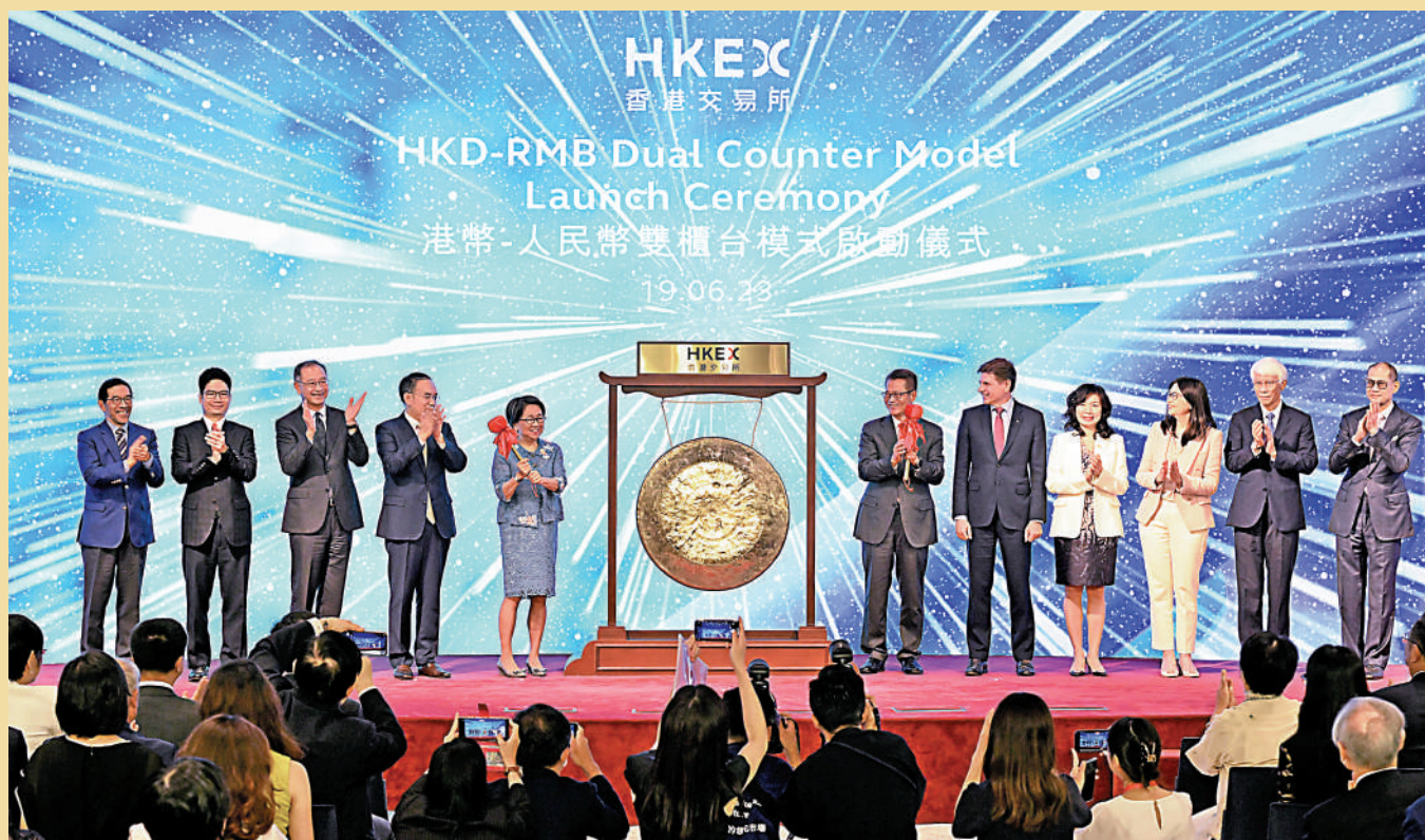
港交所今年6月推出「港幣—人民幣雙櫃台模式」，為香港資本市場增添動力，同時為離岸人民幣資金提供新出路。