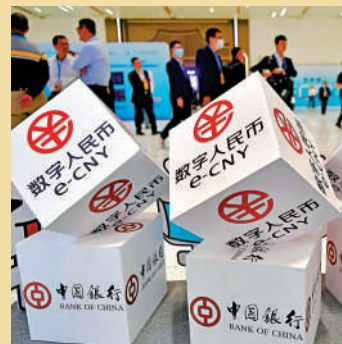
▲專家認為，香港應研究配合數字人民幣走向國際化。

全球央行爭相發展數碼貨幣（CBDC），中國人民銀行與金管局2020年底開展數字人民幣跨境支付合作，