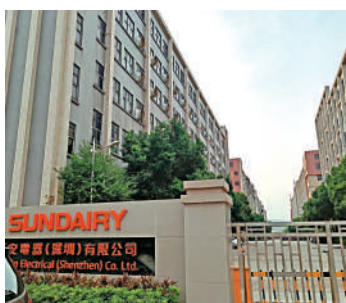
▲新安電器廠房現時已人去樓空。