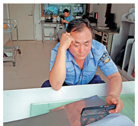
▲劉先生表示，許多同事拿着賠償金高興地離開。

經濟補償金的計算截至8月18日。劉先生表示，許多員工在這裏工作十多年，有的甚至有三十年，有一對夫婦就獲得了數十萬賠償。