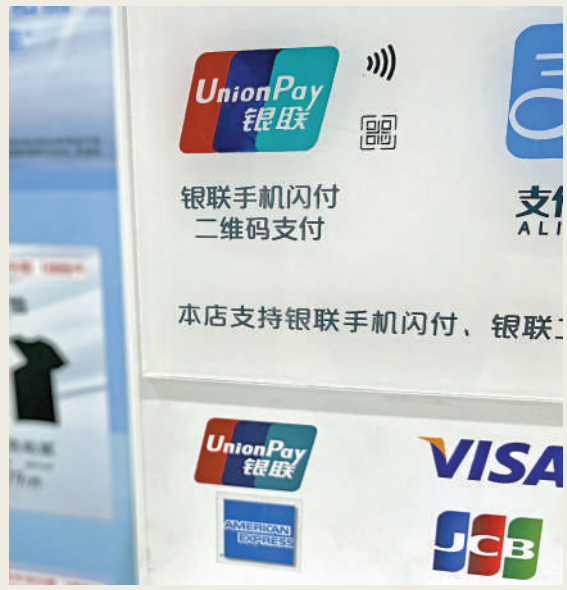
▲現時市面上有專門提供電子錢包或信用卡被盜用的保險計劃。