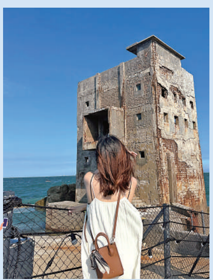
▲遊客在汕尾紅海灣旅行打卡拍照。