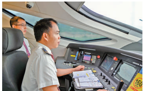
▲動車司機駕駛廣汕高鐵試運行列車。

成投資超1100億元，加快建設續建項目2190公里，計劃建成511公里，計劃新開工420公里。