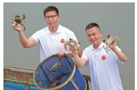
▲陽澄湖大閘蟹開捕，養殖湖區出水第一隻蟹。

現場公布了「2023年版陽澄湖大閘蟹農產品地理標誌防偽專用標識」，今年首次採用了AI點碼防偽技術，有利於消費者識別專用標識。