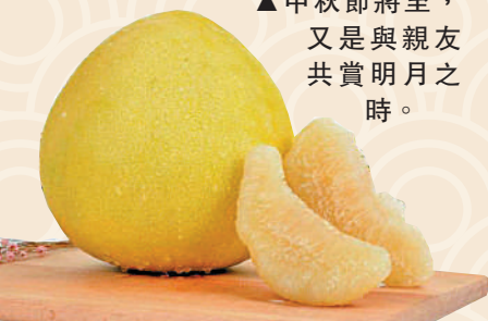
▲柚子是中秋應節水果之一。