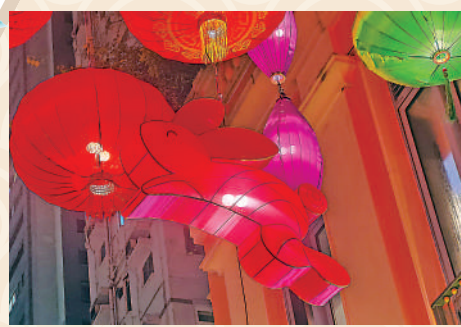
▲利東街高懸的白兔綵燈。