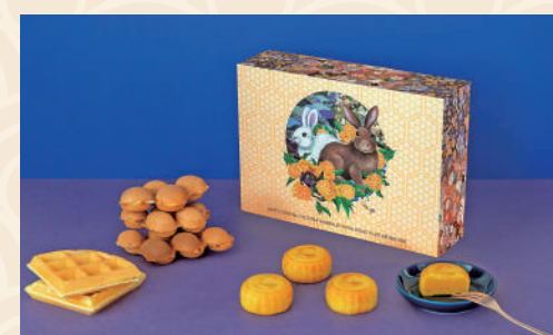
▲以「雞蛋仔」及「格仔餅」作靈感的月餅。