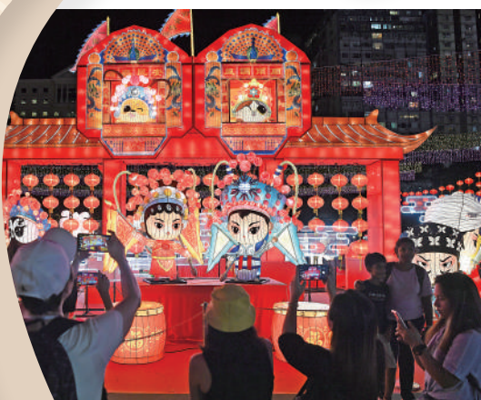
▲維多利亞公園中秋燈會。

至於其他節慶活動，雖說在傳統戲棚欣賞粵劇並非中秋傳統習俗，但今年中秋節，恰逢「中國戲曲節2023」舉辦壓軸節目「維園粵劇戲棚匯演」（即日起至10月8日），戲迷朋友可一邊感受中秋氛圍，一邊現場觀戲，過足戲癮。