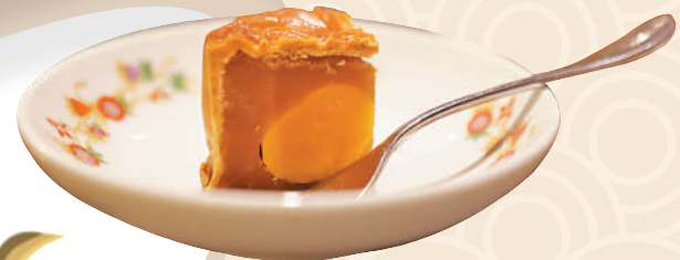
▲蛋黃蓮蓉仍是受歡迎的月餅口味。

此外，在中秋節當日（9月29日），郭氏功夫金龍醒獅團總教練郭文龍將率領其團隊，在利東街表演由LED燈製作而成的18米長舞火龍，重現因新冠疫情已睽違三年的珍貴中秋舞火龍傳統。