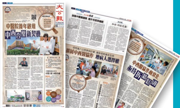
▲《大公報》本月初推出「中醫新潮流」系列報道，探討香港中醫藥發展與中西醫協作的契機與挑戰。