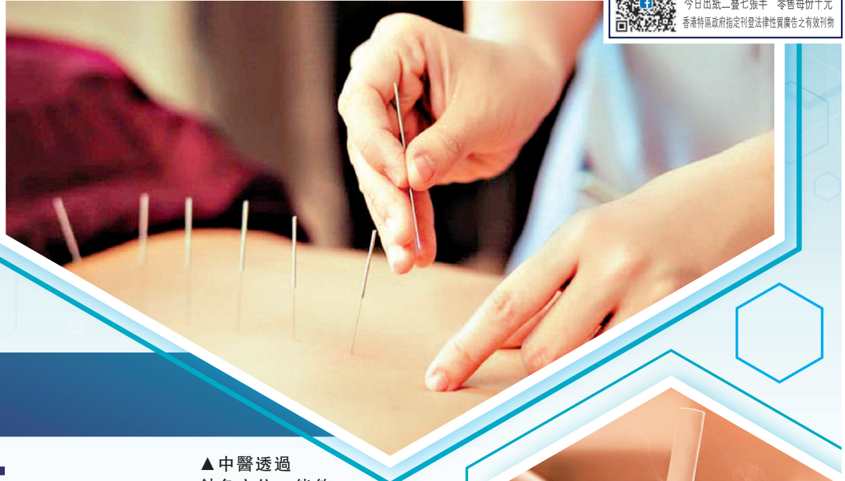
▲中醫透過針灸穴位，能夠調整體內機能，達至治療的功效。