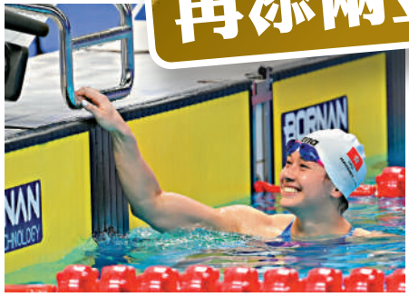
▲何詩蓓在女子100米自由泳決賽，以52秒17刷新亞洲紀錄，奪得金牌。