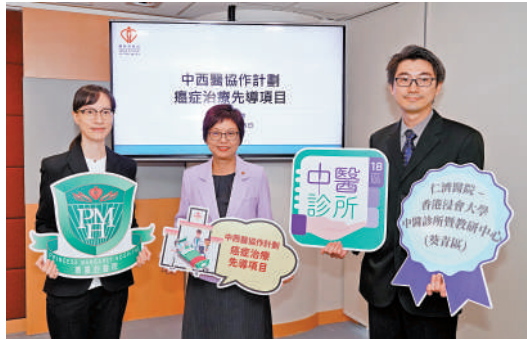
▲醫管局的中西醫協作先導計劃擴至癌症治療階段。