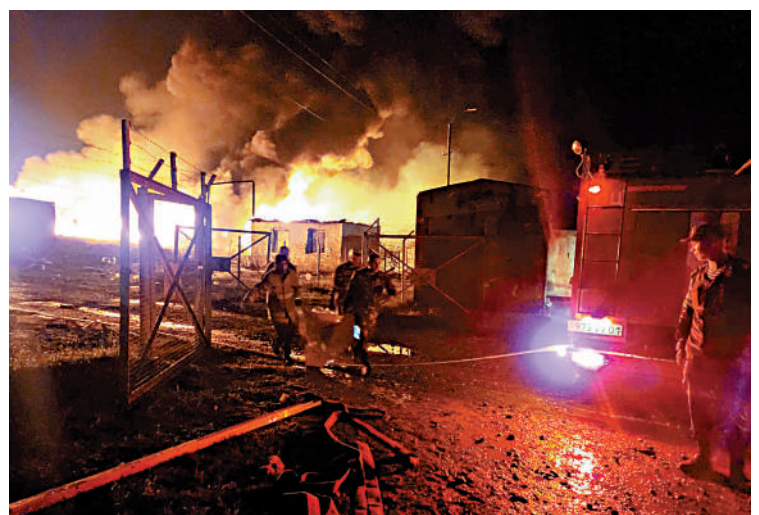
▲納卡地區一處燃料庫25日發生爆炸。

責對方攻擊邊境哨所。本月19日，阿塞拜疆對納卡地區發動「反恐行動」。在俄羅斯維和部隊的斡旋下，阿塞拜疆與納卡地區代表於20日達成停火協議。 阿塞拜疆稱，納卡地區將「完全回歸」該國。亞美尼亞則表示歡迎納卡地區的亞美尼亞族人入境。亞美尼亞政府26日稱，已有13550名流離失所者從納卡地區進入亞美尼亞。