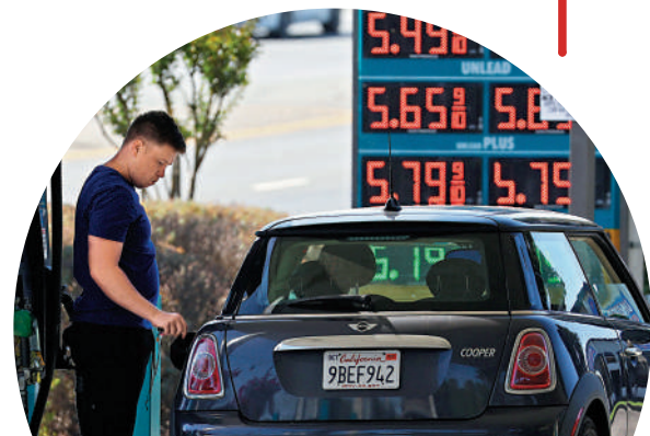
▲美國油價回升，民眾出行成本隨之上升。

方面推高通膨，另一方面將促使美國人削減餐飲、旅行等消費，從而令經濟增長陷入停滯，形成「滯脹」局面。高油價還可能令低薪或打多份工的人謹慎考慮長途通勤事宜，進而使勞動力市場趨緊。