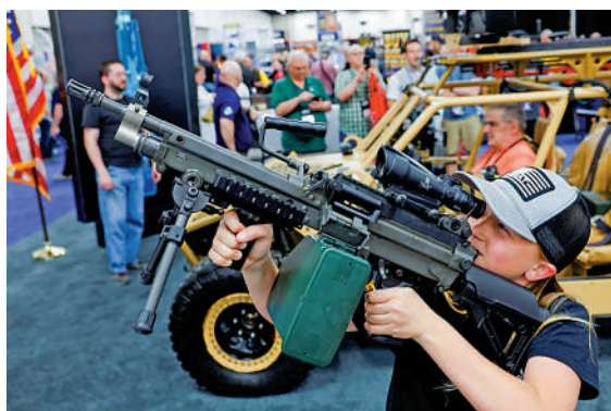
▲4月14日，美國印第安納州舉行的全國步槍協會年會上，一名與會者手持機槍。

據統計，自從禁令取消以來，美國半自動武器的出口總量已達到370萬件，在過去6年內翻了一倍多。這些槍支湧入世界各國：從監管相對嚴格的加拿大，到幫派犯罪猖獗的拉丁美洲地區，尤其是墨西哥、危地馬拉等國。雖然出口的槍支只佔美國國內銷量的一小部分，但它們對接收武器的國家的影響可能是巨大的，嚴重威脅了社會安全與地區穩定。