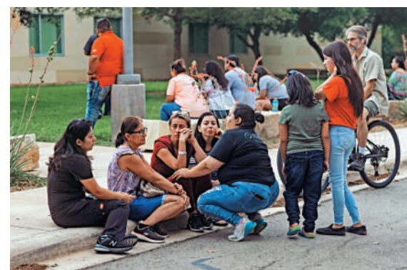
▲2022年5月美國德州小學爆發槍擊案，一名18歲槍手殺死了19名兒童和2名成人。

2022年，美國共查獲25785支未經許可、無序列號「幽靈槍」。截至2021年，美國有692起兇殺案和致命槍擊案與「幽靈槍」相關，其中包括大規模殺戮和校園槍擊事件。拜登政府對幽靈槍套裝的管制規定，被下級法院認為越權暫緩執行，不過美國最高法院接納當局申請，暫緩執行這一判決，直至上訴有結果。