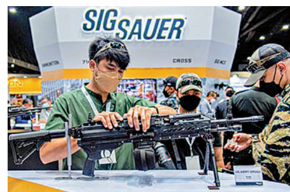
▲美國槍支製造商西格紹爾於2022年8月參加在泰國舉行的槍展。

美國商務部扮演著「槍支行業的推動者」角色，幫着招攬外國買家，陪同他們參加每年的槍支行業展會，並提供在線門戶網站，幫助國際買家與美國製造商對接。