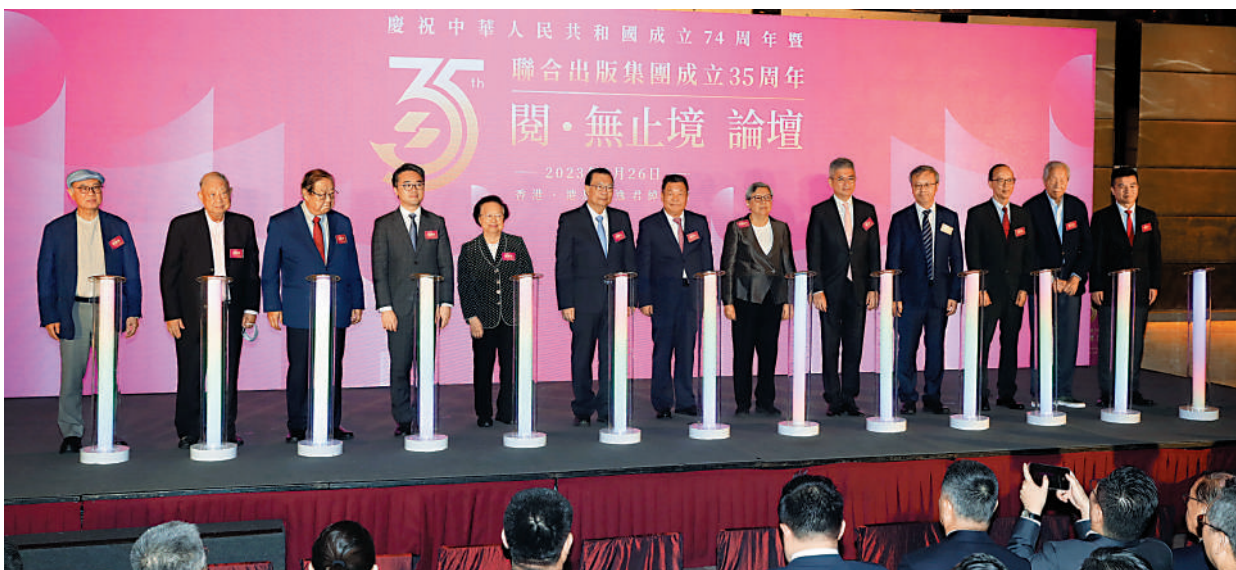
聯合出版集團成立35周年「閱·無止境」論壇。

香港中文大學原校長金耀基作主旨演講，他指出，現代人需要裝備知識，才能在世界上有競爭力，而知識除了在大學中獲取，還有很重要的一部分是來自閱讀。