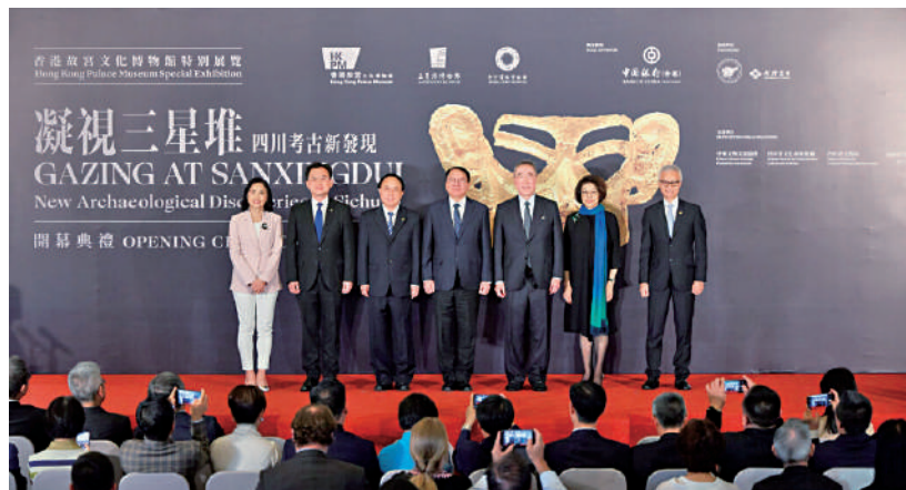
嘉賓出席「凝視三星堆」展覽開幕儀式。 四川考古

是次展覽由香港故宮文化博物館、四川廣漢三星堆博物館和成都金沙遺址博物館主辦，展出文物當中的23件為國家一級文物、55件為2020至2022年間出土三星堆遺址最新發現文物，大部分更是首次在四川省外，亦首次在香港展出。