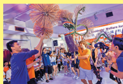
◀旅發局青年學院邀請逾70位來自各地的大學生，體驗舞火龍精髓。