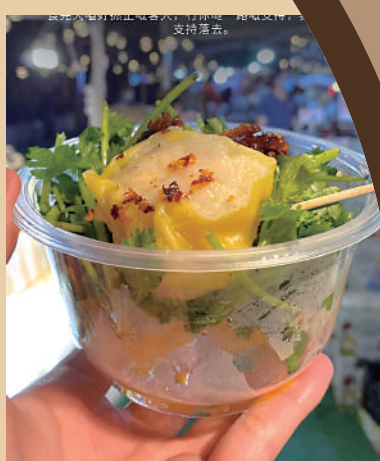
▲星光夜市的「20蚊4粒」燒賣引起網民熱議。