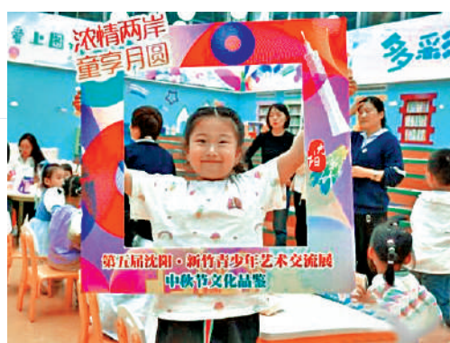
▲第五屆瀋陽·新竹青少年藝術交流展中秋節文化品鑒活動現場。

「我要做五仁月餅」「我想做桂花餡的」「我平時愛吃鹹蛋黃的，要用黃色的做餡料……」小朋友們爭先恐後分享用黏土手工製作月餅的創意和技巧，一個個漂亮的黏土月餅躍然而出。