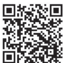
聯合招聘考試資訊

請瀏覽公務員事務局網頁(https://www.csb.gov.hk)或於Google Play / Apple App Store / 華為應用程式市場下載「政府職位空缺」流動應用程式查詢職位資料。