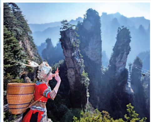
▲黃石寨索道是黃石寨景區重要的「空中走廊」。