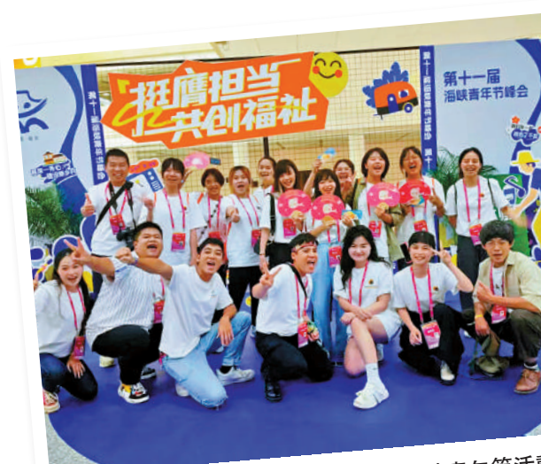
▲今年8月台青們參加在福州舉行的海峽青年節活動。