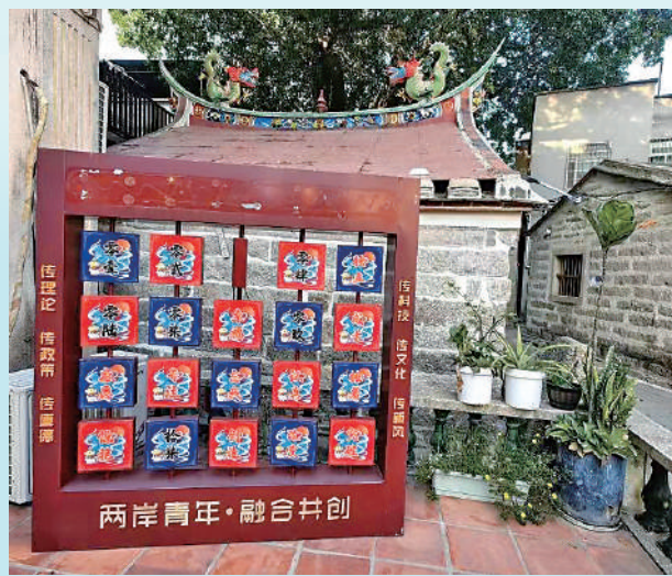
▲經過台青們的改造和設計，廈門集美後溪鎮城內村變得更加美麗。