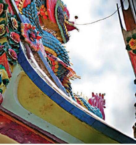
▲廈門集美後溪鎮城內村的建築頗具特色。