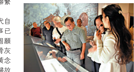
▲台灣鄖陵同鄉會參訪團成員在河南許昌市博物館參觀館藏文物。

一件容易的事，因為部分逝者的老家地址不準確，幸虧有政府的鼎力協助，最後總算都『回家』了。」