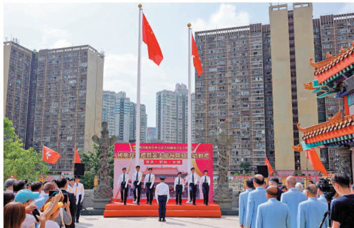
▲黃大仙祠內的財神宮平台昨日早上舉行「國慶升旗禮」，場面莊嚴肅穆。

薈色園剛於今年9月17日為薈色園護旗隊舉行成立典禮，培育一班屬校中學生接受中式步操及升旗訓練，以培養下一代的愛國精神，提升國民身份認同。作為香港首間建有升旗台的宗教場所，於7·一、回歸紀念日及十·一國慶等大日子均會舉行升旗禮，讓香港市民透過參與儀式增進愛國情懷。