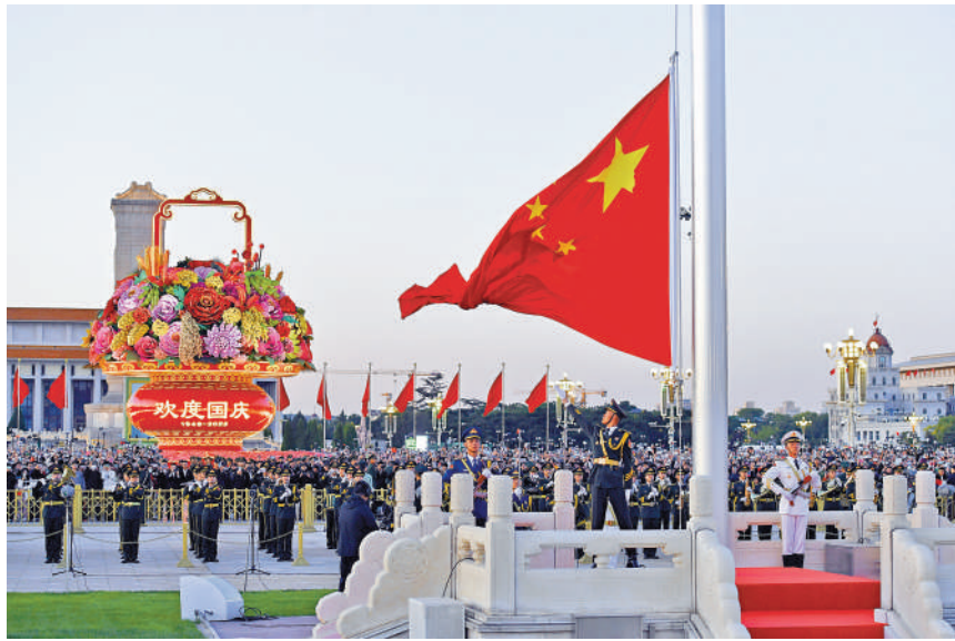
▲10月1日清晨，隆重的升國旗儀式在北京天安門廣場舉行，慶祝中華人民共和國成立74周年。