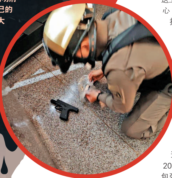
▲警方3日在案發現場檢查疑似兇器的槍支。