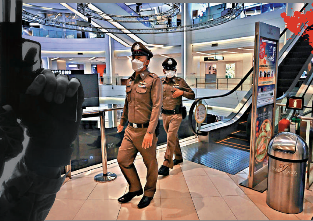
▲泰國警察4日在暹羅百麗宮購物中心(Siam Paragon)巡邏。

【大公報訊】綜合《曼谷郵報》、美聯社、路透社報道：港人遊泰熱門地點曼谷暹羅百麗宮購物中心(Siam Paragon)3日發生槍擊案，一名14歲少年使用一支經過改裝的手槍射殺2人、打傷5人後被捕，面臨蓄意殺人等5項指控。泰國的槍支暴力問題再次成為外界關注焦點。此案造成中國公民一死一傷，泰國總理賽塔4日表示，他已致電中國大使道歉，並承諾將採取預防措施，避免再次發生悲劇。