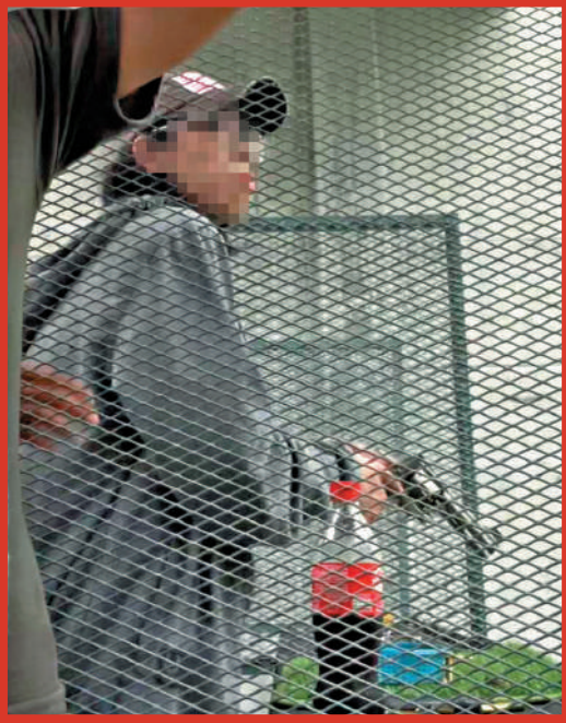
▼案發前，網友目擊槍手在曼谷射擊場打靶。網絡圖片