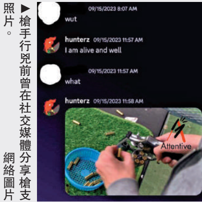
照片：槍手行兇前曾在社交媒體分享槍支網絡圖片

警方稱，槍手有精神疾病，在曼谷拉察維蒂醫院接受治療，但近來並未按時服藥。他4日在少年法庭出庭，隨後還押少年拘留中心，將接受精神評估。