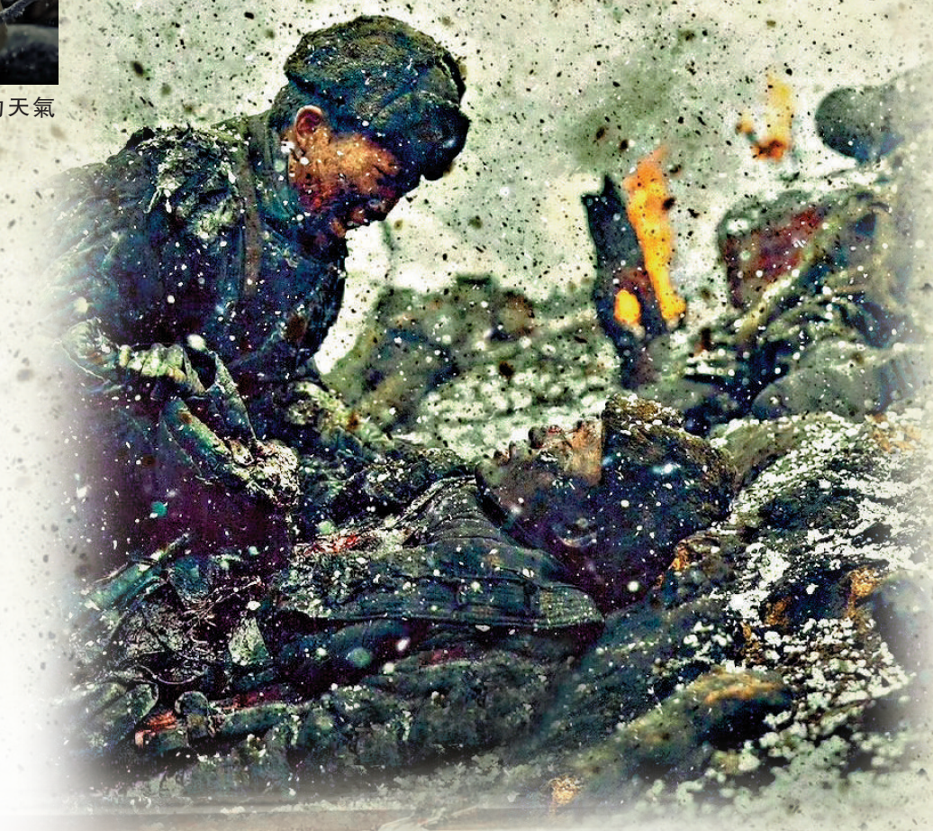
▲電影呈現戰場殘酷無情的一面。

的擬態鏡頭、搖臂鏡頭來增加代入感和寫實感，這是同類型國產電影中少有的創新。為了表達戰場的殘酷，片中有大量真實的爆破場面，加上出演士兵的群眾演員均吊「威地」拍攝，令觀眾更好地感受中國志願軍士兵頑強的精神。從拍攝花絮中，可看到就連攝影師都要吊「威地」。可以說，劇組以最大努力讓觀眾看到當時的志願軍如何在極度困難的情況下，如何與裝備精良數倍於己的敵軍作戰，付出了何等艱辛和努力。