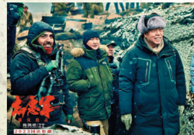
▲陳凱歌（右）在《志願軍：雄兵出擊》拍攝現場。