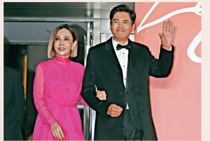
▲周潤發（右）偕太太陳蒼蓮亮相紅毯。