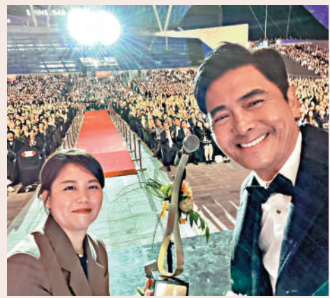
▲周潤發（右）與全場觀眾大合照。

另外，發哥一眾圈中好友拍下祝賀片段，大會安排在台上播出，當中包括劉德華、李安、許鞍華、賈樟柯、朴贊郁等。負責頒獎的宋康昊表示，能夠頒發亞洲電影人獎給發哥這位很多電影人心中的偶像，意義非凡。