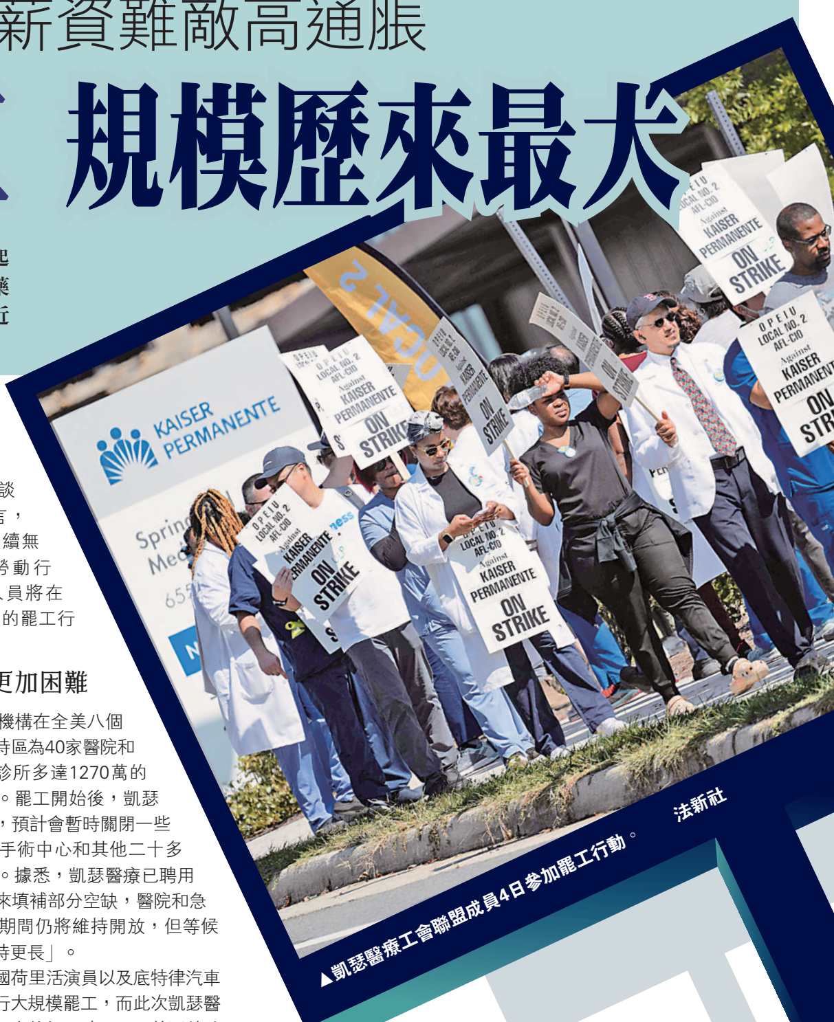
▲凱瑟醫療工會聯盟成員4日參加罷工行動。

目前，美國荷里活演員以及底特律汽車業工人仍在進行大規模罷工，而此次凱瑟醫療集團工人罷工事件仍反映了眼下美國勞動力市場緊張、通脹高企造成生活成本上漲等深層次困境。根據康奈爾大學勞資關係學院的數據統計，截至目前，全美今年已經有約362萬名工人進行了罷工，而兩年前同期的罷工人數僅為3.66萬人。