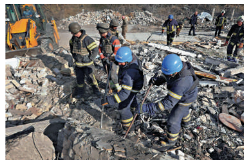
▲烏東哈爾科夫一座村莊5日受襲，救援人員在廢墟中尋找倖存者。

另一方面，美國中央司令部4日在其官網發表聲明稱，本月2日，美方向烏克蘭移交了約110萬發7.62毫米口徑子彈。據稱，這批彈藥為伊朗伊斯蘭革命衛隊違反聯合國安理會2216號決議向也門胡塞武裝運送的軍用物資，被美國海軍於2022年12月在一艘無國籍船隻上沒收。今年7月，美國政府