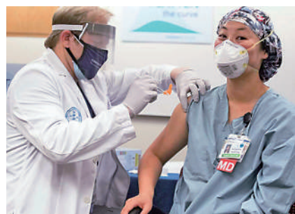
▲凱瑟醫療機構的護士2020年正在為同院醫生注射新冠疫苗。網絡圖片