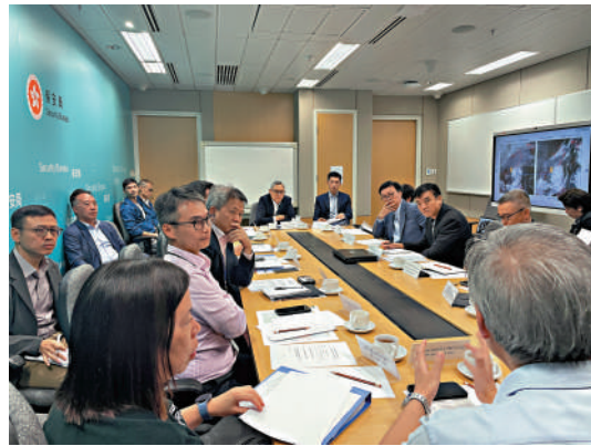
▲14個政策局及部門代表，昨午出席保安局舉行的颱風跨部門會議。

出席跨部門會議的代表來自保安局、發展局、運輸及物流局、屋宇署、土木工程拓展署、渠務署、消防處、民政事務總署、香港天文台、警務處、路政署、政府新聞處、海事處及運輸署。