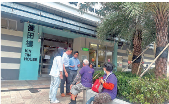
▲民建聯團隊早前在白田邨向清潔工人了解環境情況。

衛生防護中心表示，新確診的66歲男患者過往健康良好，9月23日出現排尿困難和腹脹，25日到明愛醫院急症室求診，同日入院，現時情況穩定。資料顯示，衛生防護中心於9月22日公布一宗新確診個案，67歲男患者居於深水埗。