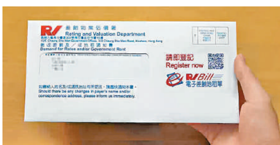
▲差餉物業估價署已經發出今年10月至12季度徵收差餉及/或地租通知書。

費方式，例如繳費靈、銀行自動櫃員機、轉數快或互聯網；上載電子支票/電子本票到「電子支票支付」網站；將劃線支票郵寄予庫務署；或前往本港任何一間郵政局或指定的便利店繳交。