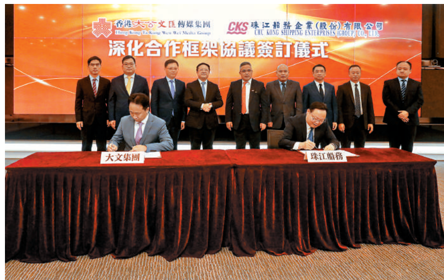
▲10月5日，大文集團與珠江船務簽訂深化合作框架協議。

「可以說，從87年到97年香港回歸前，我們一直通過在船上取報紙，架起廣州和香港社會交流橋樑。」曾和說，當時「星湖輪」和「天湖輪」每天晚上8點從廣州洲頭嘴碼頭（或香港）開出，第二天早上七時到達香港中港城碼頭（或洲頭嘴碼頭），兩艘船每天對開。「當時航班需要將近12小時才抵達。」