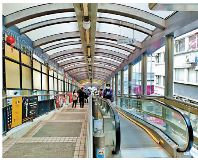
▲民建聯建議當局為扶手電梯的扶手安裝紫外線消毒裝置，並訂立「電梯扶手含菌量」標準。

政府在部分扶手電梯安裝了UV-C紫外線消毒殺菌裝置，包括上環街市皇后大道中入口的地下往1樓扶手電梯，總菌量為140CFU，相對於2020年檢測結果大幅下降97.6%，顯示紫外線消毒裝置有發揮效能。