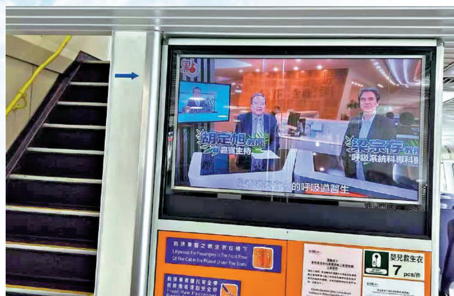
▲珠江船務來往粵港澳的高速客船上，播放大文集團旗下各平台製作有關香港的最新資訊，以及《大公報》、《文匯報》的電子報。