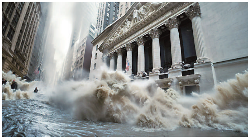
▲美債收益率長期保持高位，恐導致金融市場危機，迫使聯儲局重新擴張。

但隨着總統大選進入熱身階段，拜登勢必要維持財政寬鬆以爭取選票，這也意味着美債供給壓力不小。美國財政部今年三、四季度分別計劃淨發行1.01萬億及8520億美元國債，其中三季度側重於短債發行（8290億美元）以補充TGA賬戶（美國財政部開設在聯儲局用來支付費用的賬戶，即美國政府的消費賬戶）現金，四季度中長債規模則將增加3390億美元。