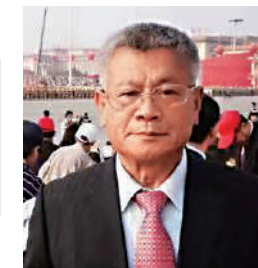
大公報記者蘇榕蓉整理

東拼西湊的「海鯤號」爆發弊案是意料之中，弊案涉嫌洩密、欺詐等多種行為，出現「皮包公司」這種幺蛾子，儼然「拉法葉艦案」重現。如今民進黨胡作非為，就是一個徹徹底底的詐騙集團。