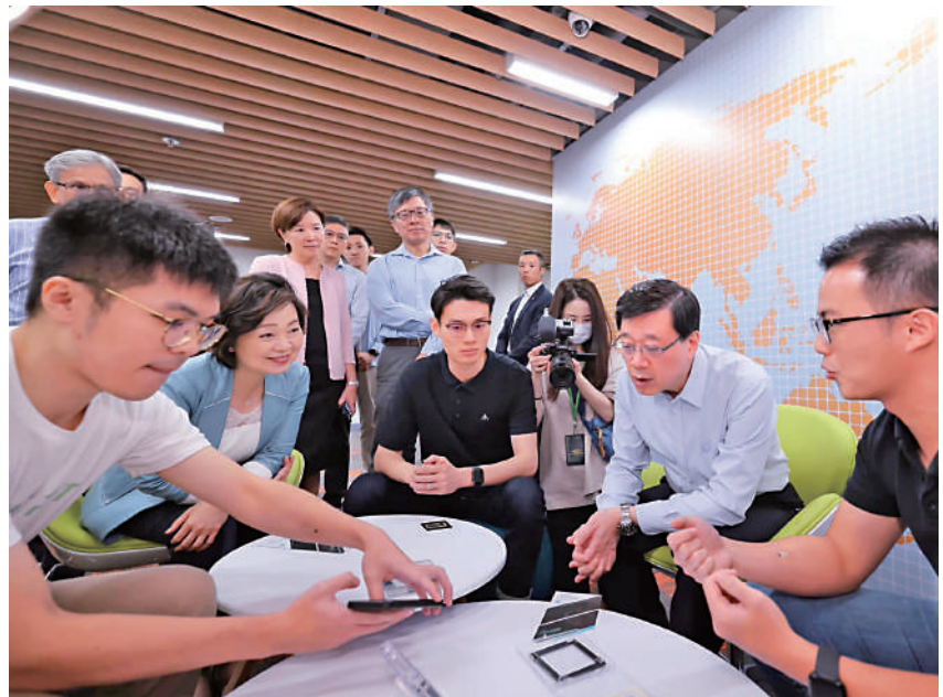
▲特首李家超上週四與教育局局長蔡若蓮及創科局局長孫東，到訪科技大學與學生交流，聆聽年輕人對政府施政的想法。