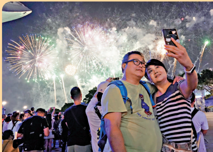
▲黃金周期間，香港舉辦了中秋綵燈會、國慶煙花匯演等一連串的慶祝活動，成功吸引更多旅客到港。

飲食界立法會議員張宇人表示，香港要團結推動經濟，「自己救自己」，由政府牽頭，食肆配合推出減價優惠，商場配合推出消費着數。他透露，本月中業界將再商討，配合政府在11月至明年1月舉辦的夜市活動。