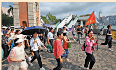
▲今年黃金周，有多達七百八十個內地入境旅行團到港旅遊。

【大公報訊】記者王亞毛報道：旅遊發展局昨日公布，受超強颱風、世紀暴雨等極端天氣影響，加上暑假結束，9月份訪港旅客初步統計約為277.1萬人次，較8月份的407.7萬人次大跌約32%。今年首九個月，錄得超過2330萬訪港旅客人次。數據顯示，9月份訪港旅客中，78%是內地旅客，涉及216.3萬人次，對比8月份數據，內地旅客約佔總體訪港人數的84%，亦出現下跌趨勢。