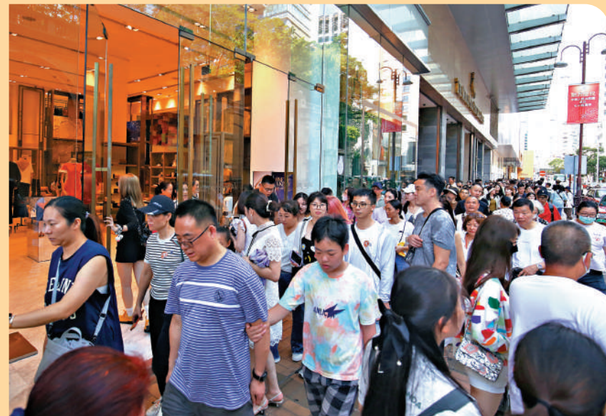
▲旅發局表示，在剛過去的十一黃金周期間，訪港內地旅客的初步數字約110萬人次，已恢復至疫前水平。