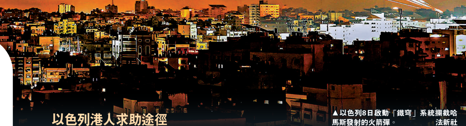
▲以色列8日啟動「鐵穹」系統攔截哈馬斯發射的火箭彈。

埃及內政部8日證實，一名埃及警察在該國地中海旅遊城市亞歷山大向以色列遊客開槍，造成兩名以色列人及一名埃及導遊死亡。