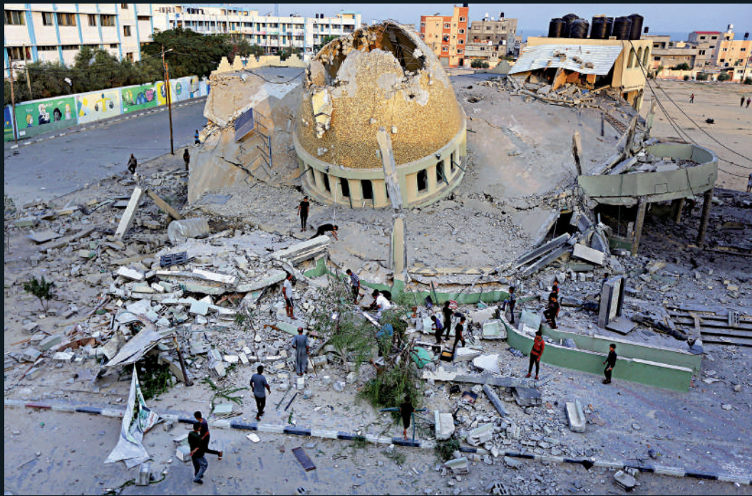
▲加沙地帶一間清真寺8日被以色列空襲摧毀。

【大公報訊】綜合《紐約時報》、BBC、半島電視台報道：以色列8日正式向控制加沙地帶的巴勒斯坦伊斯蘭抵抗運動（哈馬斯）宣戰，稍早前以色列總理內塔尼亞胡宣稱將發動大規模反攻，並提醒國民準備迎接一場「漫長而艱難的戰爭」。此次巴以衝突是1973年10月6日第四次中東戰爭以來最嚴重的一次，截至8日，以色列一方的死亡人數超過600人，另有超過2000人受傷；巴勒斯坦至少370人死亡，約2200人受傷。