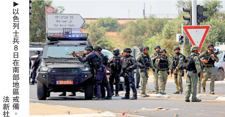
▲以色列士兵8日在南部地區戒備。

以色列和巴勒斯坦7日爆發新一輪軍事衝突，哈馬斯當天在猶太假日期間從海陸空三路對以色列發起「阿克薩洪水行動」。哈馬斯向以境內發射5000多枚火箭彈，滲透22個以色列城鎮和軍事基地。以軍與哈馬斯武裝人員激烈交火，並展開「鐵劍行動」，向加沙地帶發動大規模空襲，摧毀數十棟房屋。黎巴嫩真主黨也加入戰局，在北部向以軍陣地發射火箭彈和炮彈。