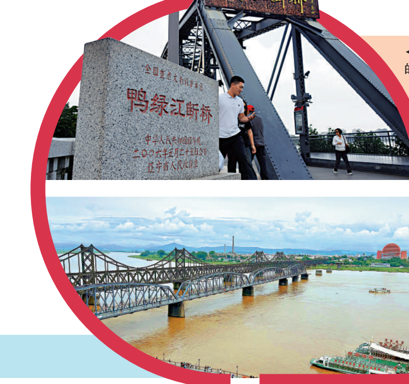
位於遼寧丹東的鴨綠江斷橋，每年吸引大量遊客前來打卡。

爭中志願軍渡江作戰和運送作戰物資的重要通道。由於這處遺址只剩下木結構橋墩，只能在河水退落時才能看到。近年來，隨着史料研究的進一步推進和紅色旅遊不斷興盛，原本作為「小眾景點」的燕窩鐵路橋遺址漸漸被人們