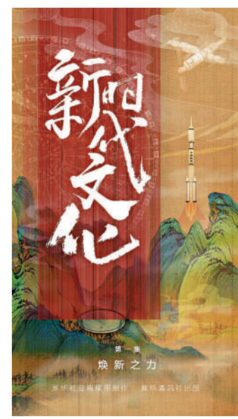
五集政論片《新時代文化》第一集《煥新之力》海報