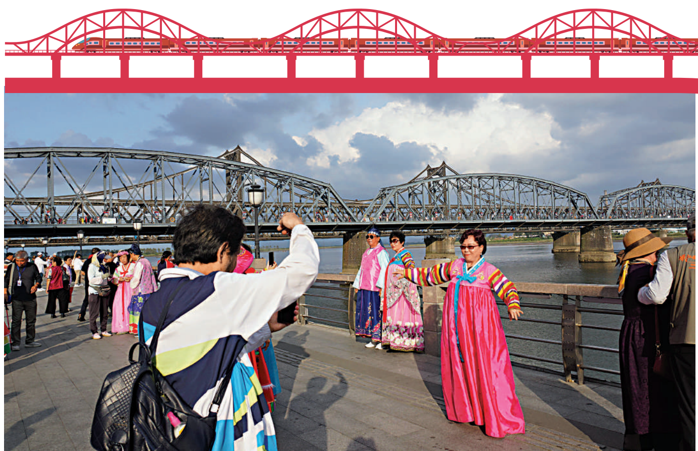
▲遊客在遼寧丹東鴨綠江畔，身着朝鮮族特色民族服裝拍照留念。

靜謐的鴨綠江，滄桑的鐵橋，川流不息的遊客，共同構成了遼寧丹東邊境旅遊最具標誌性的場景。連接中國與朝鮮的五座橋樑橫亘於蜿蜒流淌的鴨綠江上，當中的四座都分布在丹東，且以集中在丹東口岸附近的鴨綠江斷橋和中朝友誼橋最為著名。