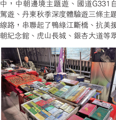
▲在鴨綠江畔的夜市上，與朝鮮相關的商品琳琅滿目。

據今年5月丹東市發布的旅遊數據顯示，邊境風情遊仍是丹東領銜假日旅遊的重要產品。五一期間，鴨綠江斷橋景區共接待遊客達9萬人次，同比2019年增長31.5%，帶動周邊住宿、餐飲、小商品零售等各類門店恢復生機。「五一」又正值桃花盛花期，河口成為熱門旅遊地，共接待遊客17.5萬人次，旅遊綜合收入達2000萬元人民幣，超越2019年同期。