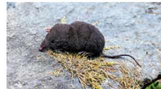
▲研究團隊發現的新種——雪山大爪鼯鼠。

nivatus)。」陳中正說。而另外2個分支，一支是已知的兩個亞種S. n. nigrescens和S. n. minor，由於S. n. minor體型明顯偏小，遂將其提升為有效種：小小大爪鼯鼠(S. minor)。另一支是採自墨脫的1號標本，「由於標本較少，還沒有正式描記，最近已完成了更多樣品的採集，很快就可以正式描記了。」