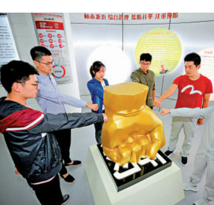
▲河北省大廠回族自治縣機關幹部在該縣一反腐倡廉宣教室接受警示教育。

經查，李福民喪失理想信念，背棄初心使命，處心積慮對抗組織審查；無視中央八項規定精神，違規出入私人會所，長期接受私營企業主安排的宴請和打高爾夫球活動，借用管理和服務對象車輛，大肆收受高檔禮品；組織原則缺失，不按規定報告個人有關事項；亦官亦商，違規從事營利性活動並頂風參與違法建築；毫無紀律意識，借用管理和服務對象的錢款和住房，長期違規佔有使用政策性住房；貪婪無度，大搞權錢交易，利用職務便利為他人在工程承攬、調整規劃方案、項目推進等方面謀利，並非法收受巨額財物。