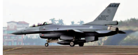
▲原訂今年結束的台軍F-16戰機性能提升計劃已延後至2026年。資料圖片

台空軍2011年提出F-16A/B型戰機性能提升案，執行142架次戰機航電、機體結構與次系統、武器、彈藥、飛行軟件及模訓等6大系統性能提升作