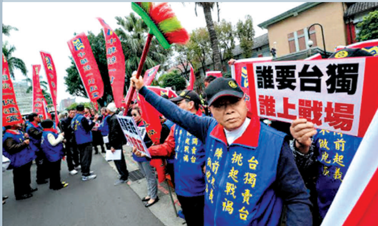
▲台灣民眾舉行集會，批評民進黨當局搞「台獨」破壞兩岸關係。資料圖片。

台灣時事評論員蘇恆恆表示，當台灣不斷強化所謂「整體防務能力建設」時，當兩岸情勢越來越緊張、面臨兵兇戰危風險時，台灣年輕人意識到如果他們去當兵，很有可能是被丟到前線作戰的第一批人，這是他們所不願面對的，所以他們選擇提前退場，不願為「台獨」賣命。