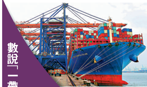
▲5月1日，一艘載有中國產太陽能設備的貨輪停靠荷蘭鹿特丹港，相關設備將經由中歐班列轉運至德國。