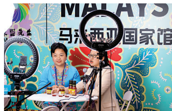
▲5月9日，馬來西亞客商（左）在第七屆全球跨境電子商務大會展覽展示活動中直播帶貨。中新社

路、能源、水利等進行數字化升級改造，「中國—東盟信息港」「數字化中歐班列」中阿網上絲綢之路等重點項目全面推進，「數字絲路地球大數據平台」實現多語言數據共享。 叢亮指出，數字基礎設施建設合作持續提升聯通效率，一批優質商品、技術、產品走出國門；跨境電商成為推動貨物貿易增長的新引