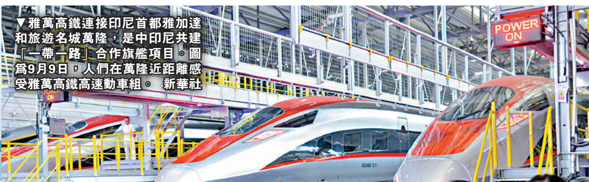
▼雅萬高鐵連接印尼首都雅加達和旅遊名城萬隆，是中印尼共建「一帶一路」合作旗艦項目。圖為9月9日，人們在萬隆近距離感受雅萬高鐵高速動車組。