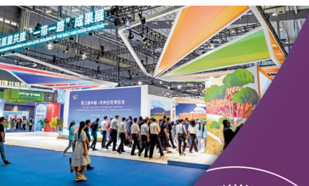
▲6月29日，在長沙國際會展中心，參會嘉賓參觀中非高質量共建「一帶一路」成果展。

在共建「一帶一路」倡議提出十周年之際，國務院新聞辦公室10日發布《共建「一帶一路」：構建人類命運共同體的重大實踐》白皮書。白皮書指出，10年來，共建「一帶一路」給相關國家帶來實實在在的利益，開闢了人類共同實現現代化的新路徑，推動構建人類命運共同體落地生根。其中，在貨物貿易方面，中國與共建國家進出口總額累計19.1萬億美元（約149萬億港元），年均增長6.4%。商務部副部長郭婷婷當日在發布會上強調，支持港澳企業參與共建「一帶一路」，打造重要的功能平台。