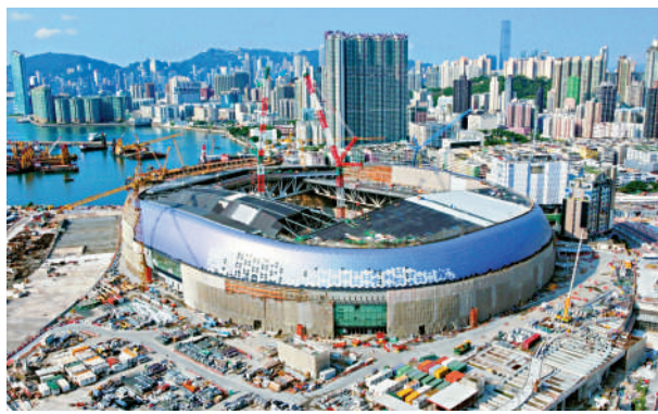
▲啟德體育園昨計劃在2025年中前，創造約2000個職位。

及操作大使、設施維護經理／技術員、活動及賽事日程管理員、園景經理、灌溉技術員、啤酒桶操作技術員等。有意應徵者，可透過網上登記或使用WhatsApp即時通訊軟件，發送訊息至啟德體育園招聘熱線（852）6926 8108查詢。