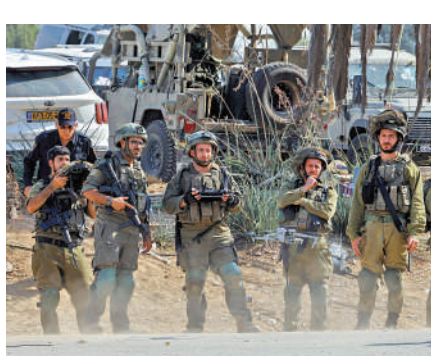
以色列士兵在與加沙地帶接壤處操控無人機進行監控。

內塔尼亞胡的前國家安全顧問阿米多爾坦言，這是一次「重大失敗」，「哈馬斯的這次行動實際上證明了我們在加沙的情報能力並不好」。哈馬斯高級官員巴拉克表示，該組織對以色列情報機構嚴重失靈「感到驚訝，以色列軍隊是紙老虎」。