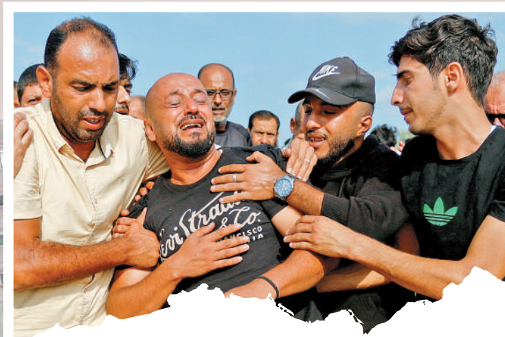
巴勒斯坦民眾在親友的葬禮上痛哭。