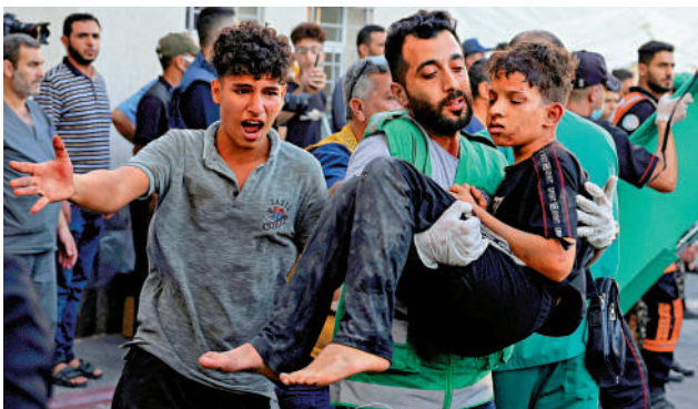
一名男子抱著一名受傷的兒童衝進加沙城一間醫院。

據悉，在瓦赫里伊發文稱將暫停對巴援助後，西班牙、葡萄牙、盧森堡、愛爾蘭等國公開對此表示反對，認為這一決定應由各成員國共同商議後決定。盧森堡外長阿瑟伯恩稱：「我們的援助是給加沙人民的，並不是給哈馬斯送錢。」