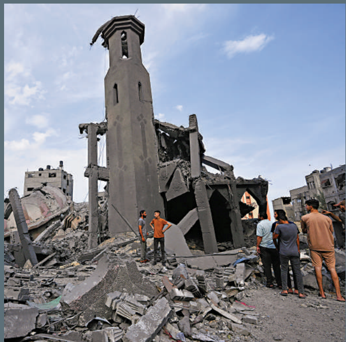
以色列空襲摧毀加沙城的一座清真寺。

加沙地帶總人口約230萬。自哈馬斯2007年6月控制當地後，以色列封鎖加沙地帶，把那裏變成「世界上最大的露天監獄」。因長年與以色列處於敵對狀態，當地80%的人口依賴人道主義援助過活。